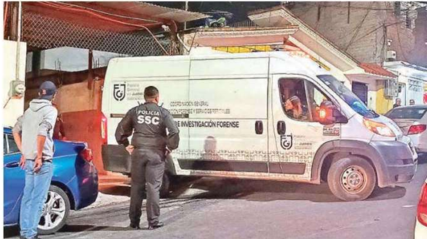
Paramédicos adscritos a la emergencia llegaron para brindar los servicios pre-hospitalarios, pero nada pudieron hacer por ellos