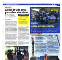
La Policía Cibernética señala que ciberdelincuentes usan hasta logos oficiales.