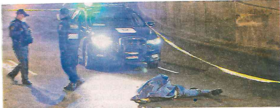
Sobre los carriles centrales de Periférico quedó el cuerpo del motociclista