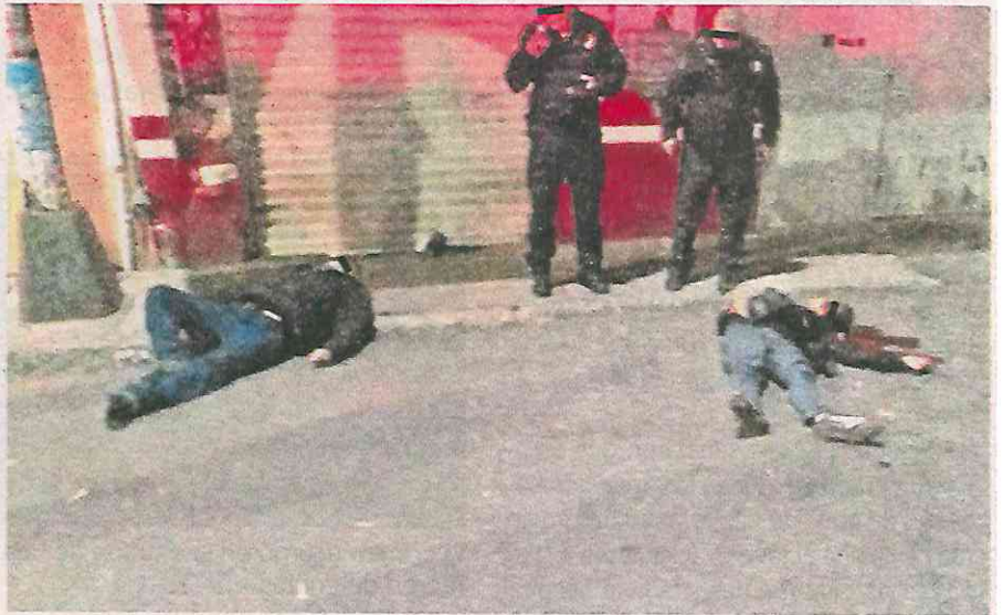
Los cuerpos quedaron tendidos en el asfalto. Se presume que fueron ultimados por una venganza

Cuando los oficiales llegaron al sitio, se percataron de dos sujetos inconscientes, recostados en el pavimento con lesiones hemáticas visibles en la cabeza, por lo que solicitaron servicio médico.