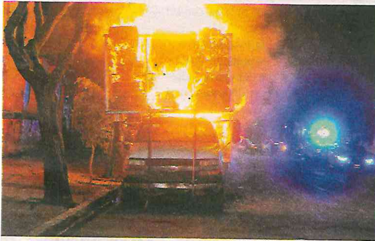
La camioneta se incendió en la calle Enrico Martínez