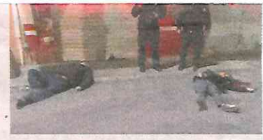
Ya se investiga el móvil

Una vez que los paramédicos verificaron el fallecimiento de los dos hombres, elementos de la Secretaría de Seguridad Ciu-