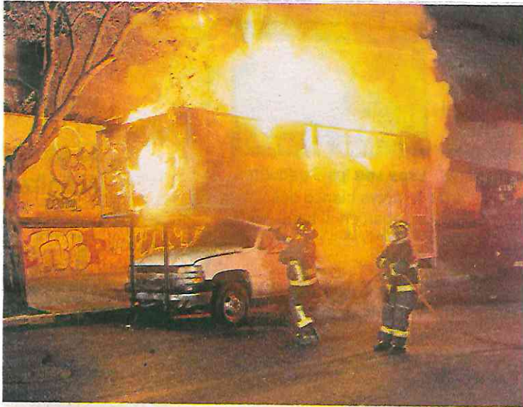
Bomberos sofocan las llamas de la camioneta incendiada. Se investiga si fue accidental o intensional