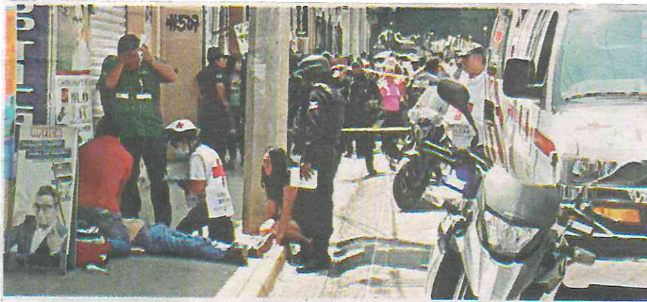
Robo a transeúnte y a comercio, a la alza