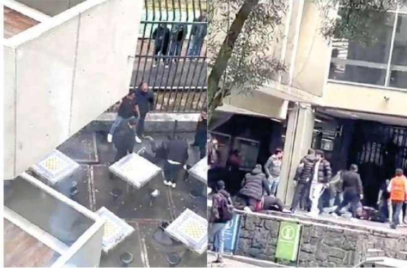
Encapuchados eran profesores de la Facultad, de acuerdo a testimonios