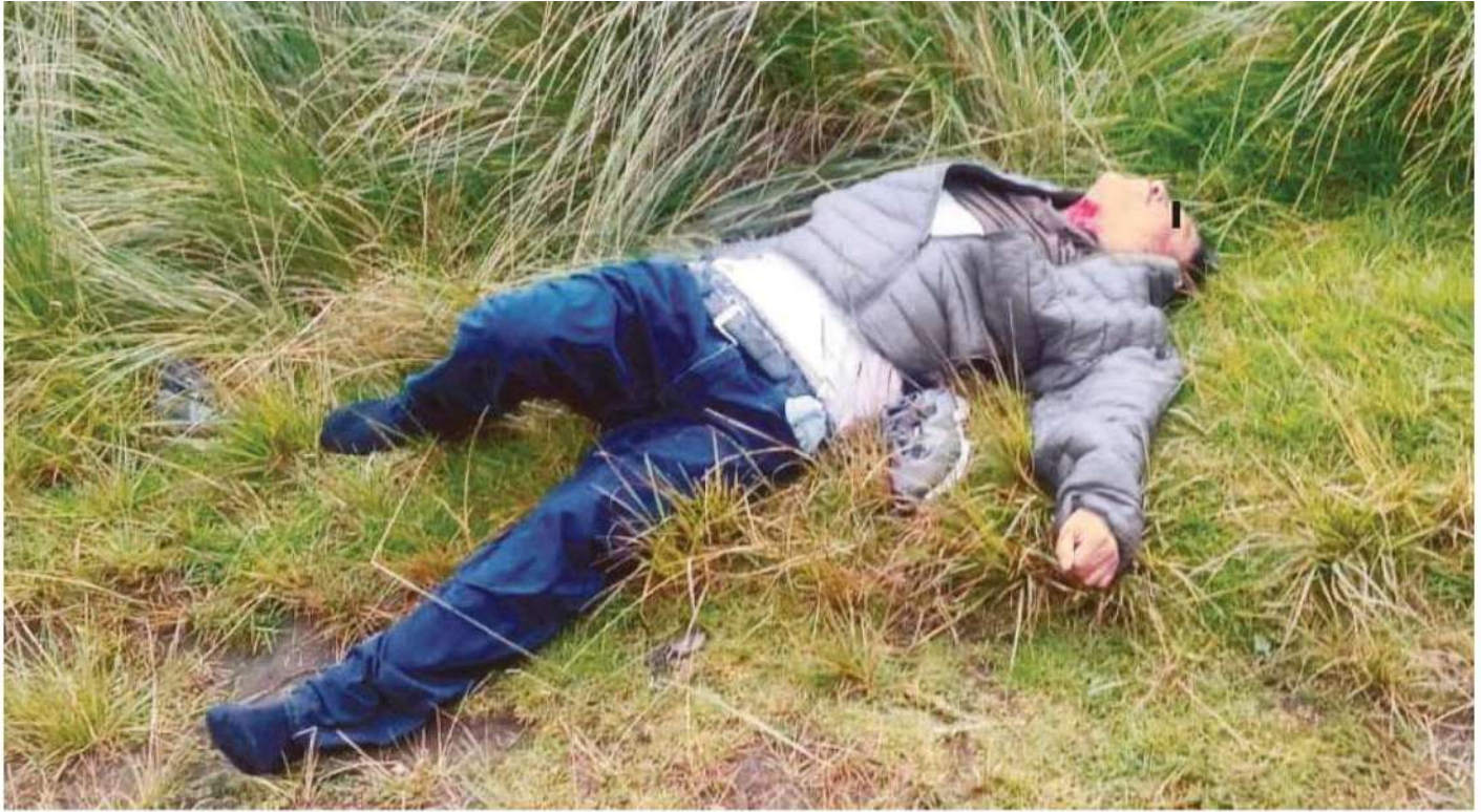
Así quedó el cuerpo del hombre, a un costado de la calle Antiguo Camino a Cuernavaca; su verdugo se fue directo a la yugular