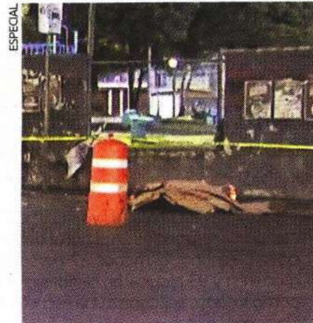
El cadáver del ingeniero fue custodiado por policías hasta que fue retirado.

Para deslindar responsabilidades, el conductor de la máquina involucrada fue traslado a una agencia del Ministerio Público.