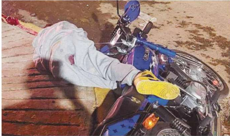
Justo frente a la puerta de su casa recibió los múltiples impactos de bala