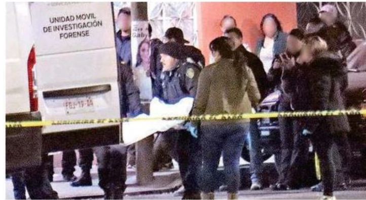
Paramédicos del Escuadrón de Rescate y Urgencias Médicas intentaron reanimar al masculino agredido, pero éste ya no contaba con signos vitales