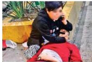
Por incidente vial un hombre murió a balazos

Testigos del lugar no daban créditos por el incidente vial que le costó la vida de un hombre. Oficiales de la Secretaría de Seguridad Ciudadana arribaron, pero ya era muy tarde al no tener signos vitales el hombre. Tanto la Secretaría de Seguridad Ciudadana y la Fiscalía de la Ciudad de México han pedido los videos de las cámaras de video del lugar donde fue asesinado el sujeto a balazos y continuar con las investigaciones y den con el paradero del presunto homicida.