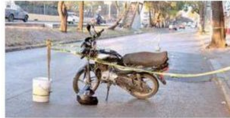
A unos metros del cuerpo quedó la motocicleta marca Bajaj tipo Platina 100, en color negro

Integrantes del área pericial y Forense de la Fiscalía capitalina, procedieron a realizar el levantamiento del cadáver para trasladarlo al anfiteatro correspondiente, en donde hasta el momento permanece en calidad de desconocido.