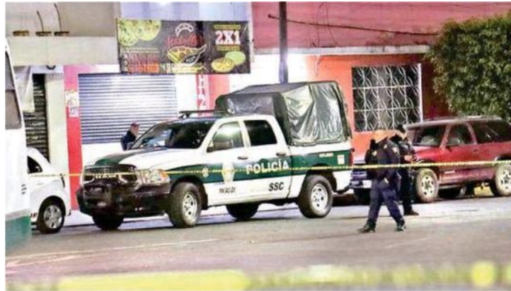
El propietario de una pizzería ubicada en el perímetro de la colonia Reynosa Tamaulipas, en la alcaldía Azcapotzalco, muere tras haber sido atacado a balazos

Horas más tarde, integrantes del área pericial y Forense de la Fiscalía capitalina, llegaron al lugar y tras recabar los indicios necesarios para esclarecer los hechos, procedieron a realizar el levantamiento del cadáver para trasladarlo al anfiteatro correspondiente. La Fiscalía ya indaga.