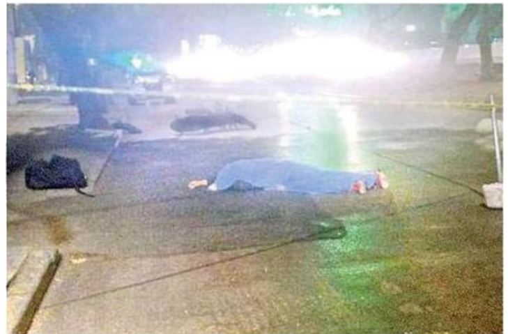
Por circular a exceso de velocidad joven motociclista pierde la vida