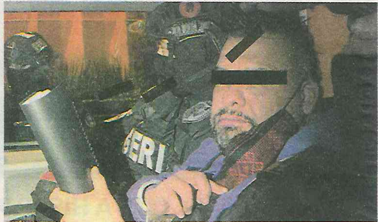
Lo mantienen en jaque

A través de anuncios engañosos en periódicos e internet con ofertas de trabajo en las oficinas del partido enganchaban a jovencitas