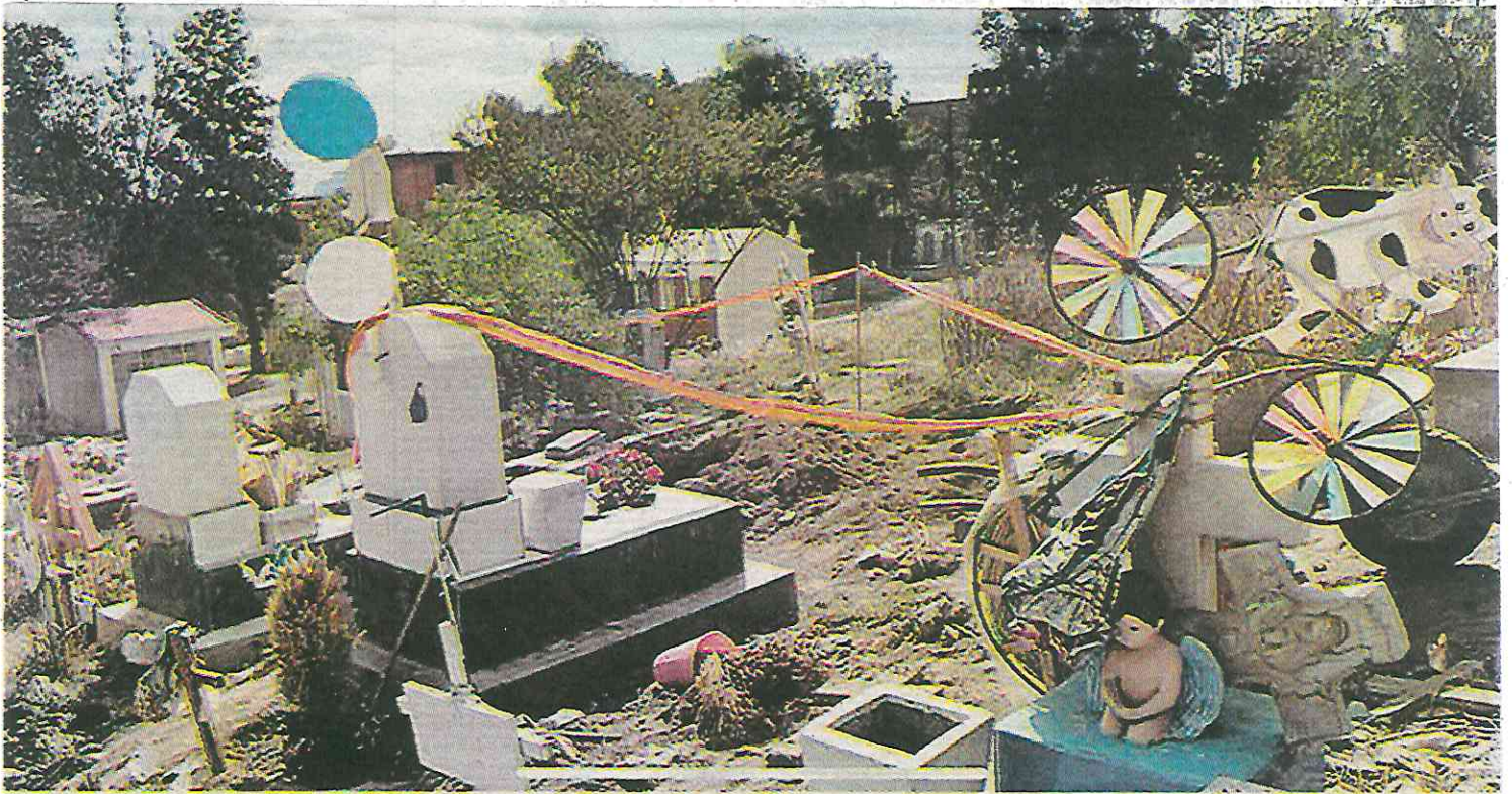
El panteón de San Nicolás Tolentino, en Iztapalapa, se encuentra sin mantenimiento.

Sin rastro. La Comisión Nacional de Búsqueda reporta la sustracción de 109 niños de dos años o menos de 2018 a la fecha; Barbosa destituye a secretario de Seguridad