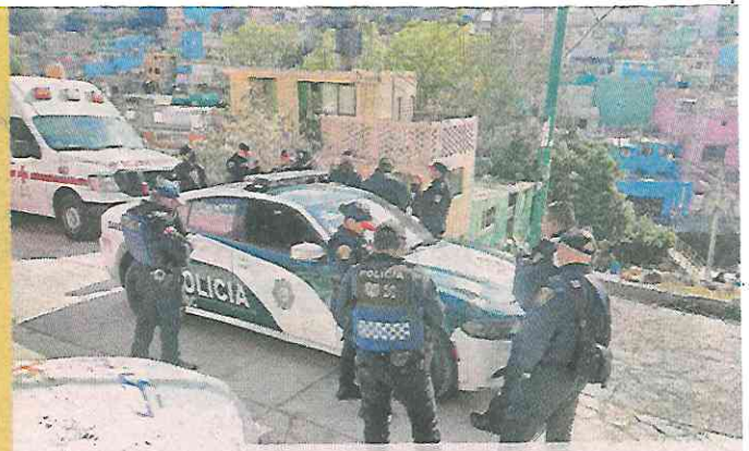
■ La detención ocurrió en el límite del Pueblo de Santa Lucía y la Colonia Corpus Christi.

patrulla, mientras los policías sacaron al detenido para que posara para las fotos que usarían en la puesta a disposición por robo con violencia.