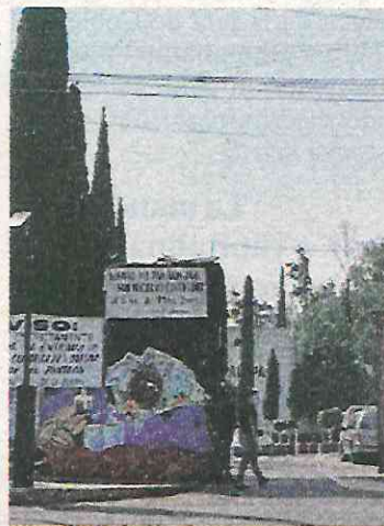
Panteón de San Nicolás Tolentino.

La tarea del Gobierno CDMX, es con la Secretaría de Seguridad Ciudadana y la Fiscalía local , pongan resguardo, cámaras de vigilancia o una descripción seria de espacios para enterrar a los difuntos.