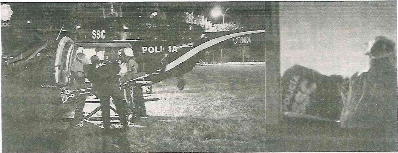
El agente herido fue trasladado vía aérea a un nosocomio