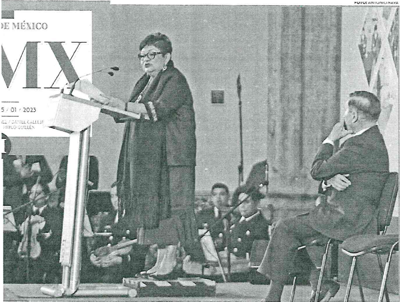
• BALANCE. La titular de la Fiscalía General de Justicia dijo ayer que alistan más acusaciones contra exfuncionarios.