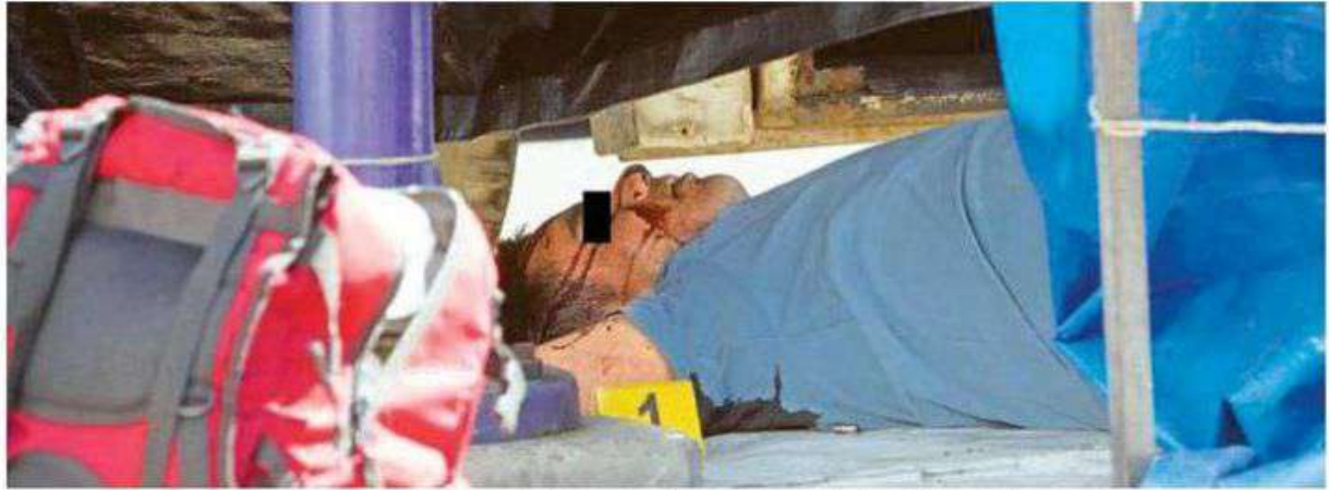
Fueron varias las detonaciones, una de ellas lo hirió en el cuello, por lo que de inmediato se desvaneció