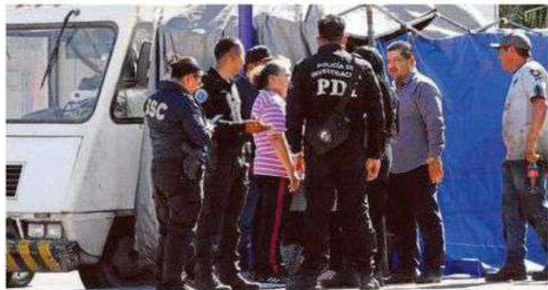
Al lugar arribaron paramédicos de Protección Civil, quienes certificaron la muerte del tianguista

La investigación para determinar las causas del ataque quedó a cargo de los agentes y peritos de la Fiscalía capitalina.