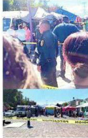
El hecho causó pánico

A través de un comunicado, la SSC indicó que el masculino murió a causa de dos disparos que recibió a la altura del cuello.