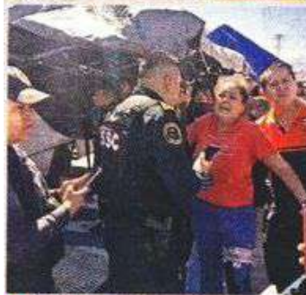
Familiares de la víctima llegaron y fueron interrogados por la Policía.