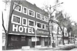
En este hotel se encontró