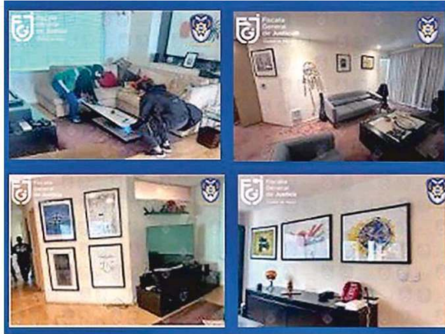
Por cateos en Jardines de la Montaña y Copilco Universidad, los investigadores recuperaron piezas de arte, y procedieron al resguardo de ambos inmuebles.