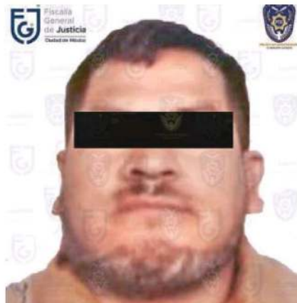
Presunto responsable en el homicidio de cuatro personas

El día de los hechos, las víctimas realizaban ejercicio en el gimnasio "Body Extreme", ubicado en la calle Panaderos, colonia Morelos, entonces delegación Venustiano Carranza, cuando llegaron varios individuos, entre ellos "El Colosio", y los agredieron con disparos de arma de fuego, ocasionándoles la muerte.