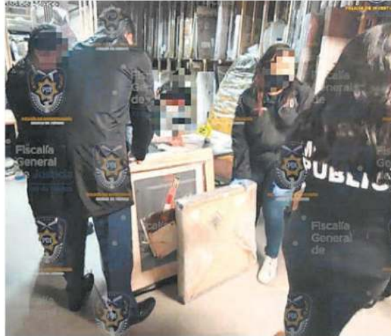
Son piezas de artistas nacionales y extranjeros