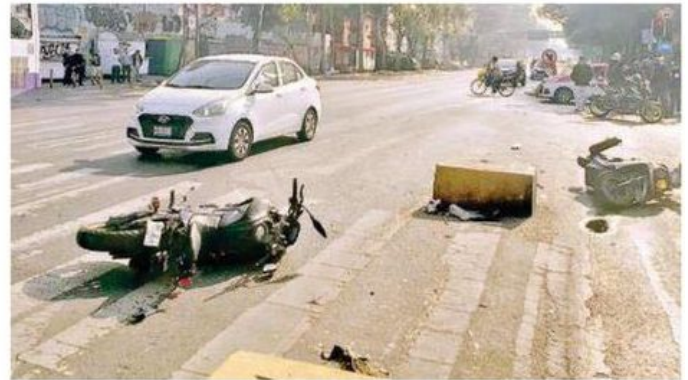
Paramédicos encargados de atender el reporte, valoraron a los lesionados y determinaron que no ameritaban traslado hospitalario