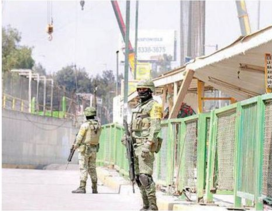
Elementos del Ejército Mexicano resguardan las obras tras el incidente en el Cetram Santa Martha