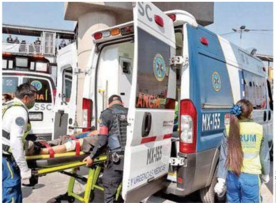
Los servicios de emergencia llegaron rápido para auxiliar a los heridos y a quienes sufrieron crisis nerviosa

CONTARÁ CON interconexiones con la línea 10 del trolebús elevado Eje 8 Sur, que va de Santa Martha a Constitución de 1917, así como con la línea A del Metro, que va de La Paz a Pantitlán y la línea 2 del Cablebús