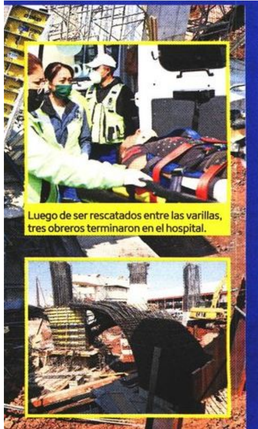
Luego de ser rescatados entre las varillas, tres obreros terminaron en el hospital.

EL DATO BENEFICIO El trole elevado llegará a Chalco y, dicen, reducirá entre 33 y 45 minutos los trayectos de dos horas.