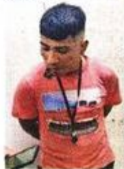
Los cuatro fueron llevados ante el MP.