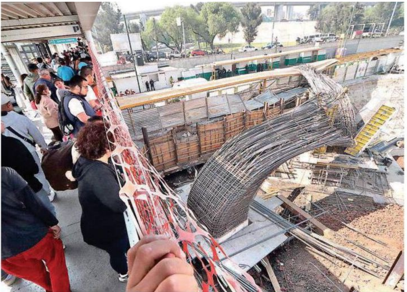
Momentos de terror vivieron los trabajadores tras ver caer dos torres de varillas durante la construcción del Trolebús Chalco-Santa Martha