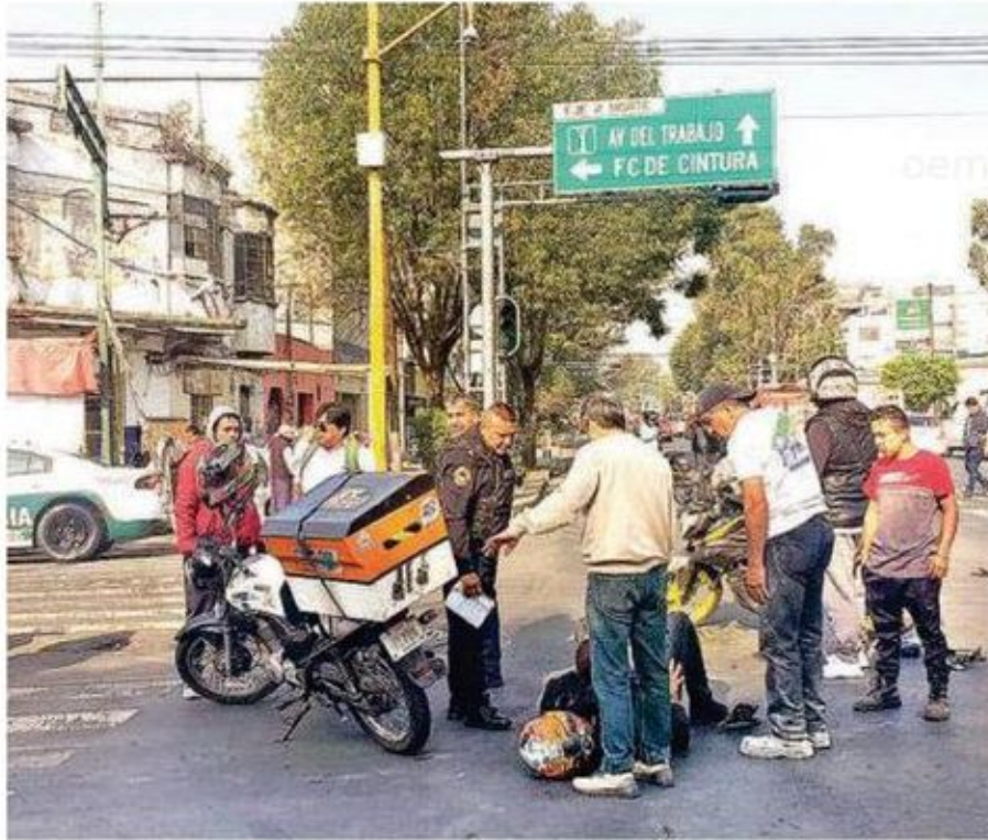
El conductor del vehículo involucrado detuvo su marcha y se acercó al lugar para intentar auxiliar a los afectados