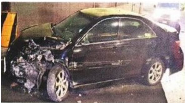
Los detenidos estaban junto a este auto siniestrado.