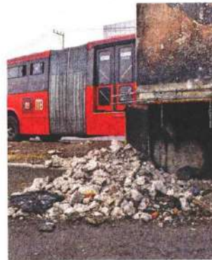
En febrero, un tráiler se impactó contra un muro de la estación.

Por ello, tiene dos estructuras que funcionan para desahogar el flujo de pasajeros, pero al estar cerrada una, se complica la movilidad de los mismos, y de acuerdo con la opinión de usuarios, también ha afectado la frecuencia del paso de las unidades. ●