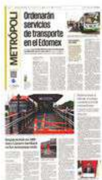
La plataforma de San Lázaro con dirección a la Preparatoria 1 sigue cerrada, por lo que los usuarios se aglutinan en la otra estructura.