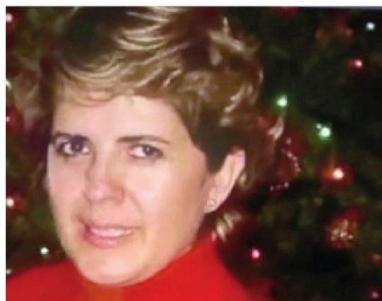
La buscan por aire, mar y tierra

impactos de bala, seis a la altura de la cabeza y seis en el tórax, presentaba la víctima, según los resultados de la necropsia.