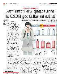
Gráfico: Daniel Rey