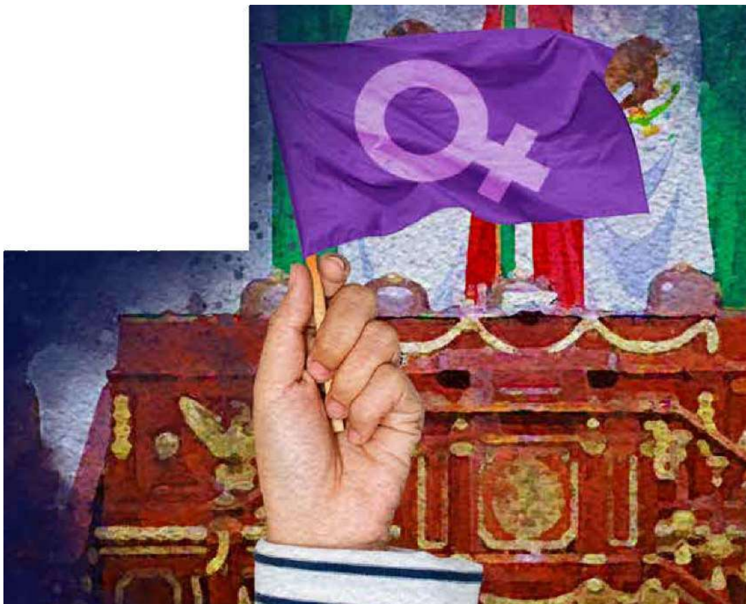
Marisela Zúñiga Cerón es diputada de Morena desde el 2018 por el Distrito 27, de la alcaldía Iztapalapa.