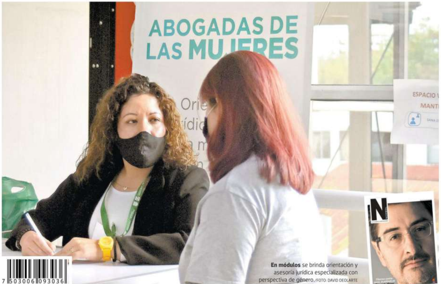
En módulos se brinda orientación y asesoría jurídica especializada con perspectiva de género.

A TRAVÉS DE ABOGADAS DE LAS MUJERES EN LOS MP, LA FISCALÍA CAPITALINA HA RECIBIDO CASI 11 MIL QUEJAS Pág. 3