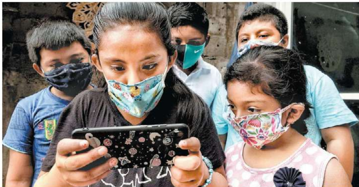
Familias en Juchitán, Oaxaca, se solidarizan con los vecinos que no tienen televisión ni computadora.