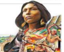
Ilustración: Jesús Sánchez