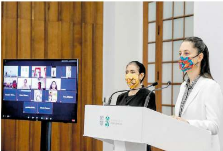
La jefa de Gobierno ha propuesto capitalizar al instituto de salud

"Desde que llegamos había una deuda del gobierno de la ciudad al ISSSTE por los servicios que tiene que pagar el gobierno de la ciudad; también encontramos deuda del ISSSTE hacia la ciudad, como por ejemplo en servicios de agua potable", expuso y se comprometió a informar la totalidad de la deuda, sin embargo, hasta el