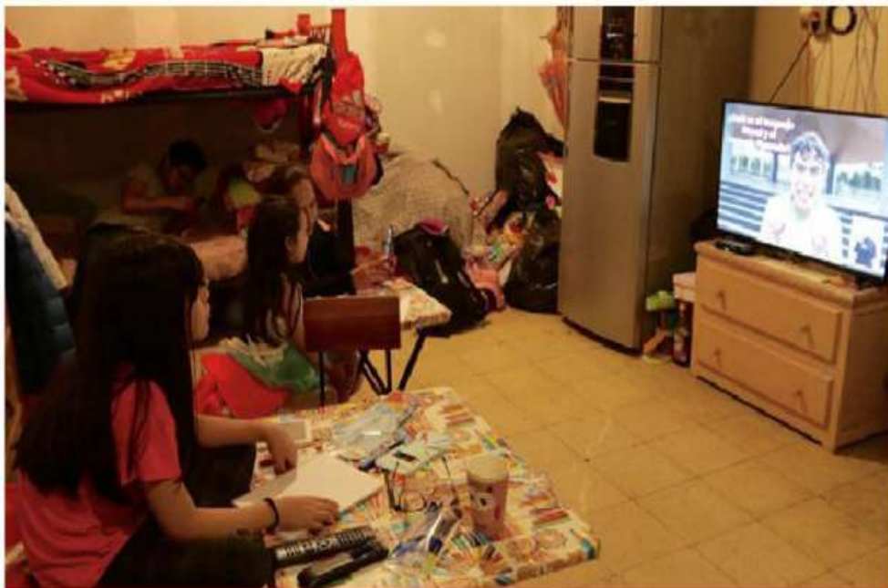
En el inicio del ciclo escolar 2020-2021, dos menores de edad toman clases al mismo tiempo, acompañadas de su madre —con celular en mano— en una vivienda de la colonia Doctores, Ciudad de México.

Sin conocer nuevos compañeros y con diferentes niveles de acceso a la tecnología, inició nuevo ciclo escolar