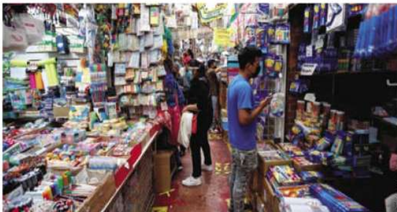
Las clases a distancia y la crisis económica han provocado bajas ventas.