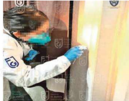
La joven fue hallada sin vida en el Estado de Tlaxcala