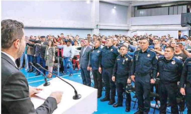
Martí Batres Guadarrama, Jefe de Gobierno con integrantes de la Comisión Ciudadana