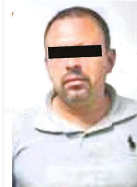
Lo detuvieron en posesión de un arma punzocortante

Los hechos se registraron cuando los operadores del Centro de Comando y Control (C2) Poniente reportaron el robo a un negocio, ubicado en la calle segunda cerrada de Texcalco, en la colonia San Lorenzo Acopilco