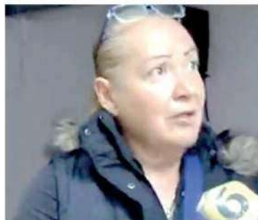
· Su mamá está destrozada