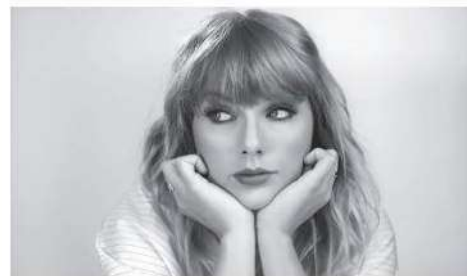
Se busca salvaguardar el ambiente seguro

Del 24 al 27 de agosto, aproximadamente 260, 000 personas arribarán al Foro Sol para ver a Tay-Tay.