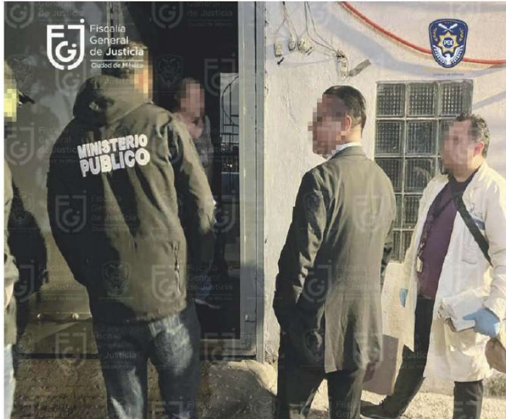
Arrestaron a dos individuos sospechosos dentro del vehículo de la joven.

Desde la madrugada de ese día, sus familiares habían perdido contacto con ella y la habían denunciado como desaparecida, manteniendo una búsqueda constante con la esperanza de encontrarla con vida.