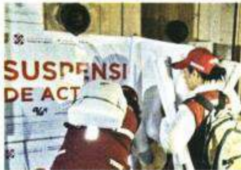
El 18 de agosto, las actividades en el bar fueron suspendidas.