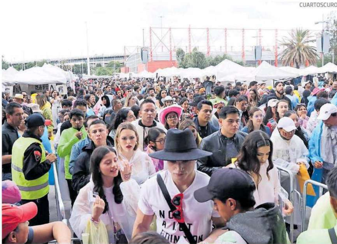
Multitudes de seguidores arribaron al Foro Sol