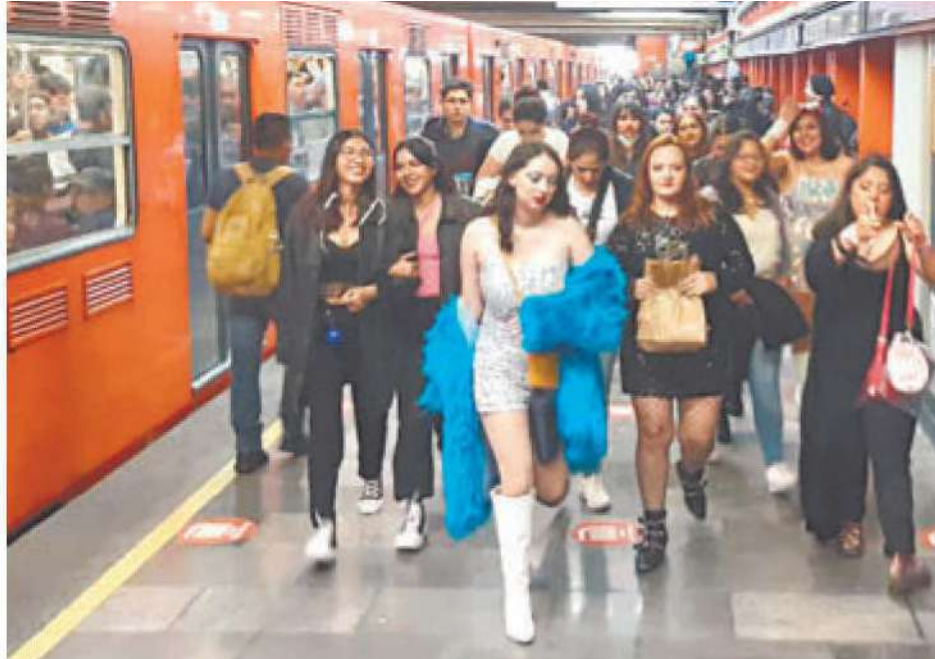
Algunos fans cantaron canciones de Taylor Swift al llegar al Foro Sol