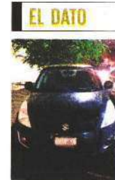
La FGJ obtuvo materiales en donde se ve a Rodolfo abordar el vehículo negro de Ivana.

“La joven acudió a un evento en compañía de su novio y al regresar a su domicilio, pasadas las 05:00 horas, presuntamente fue levantada”