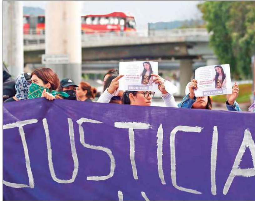
PROTESTA. Familiares y amigos de la joven de 22 años pidieron justicia por su asesinato. Fiscalías de CDMX y tlaxcalteca confirman dos detenidos.