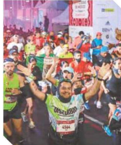
Esperan a 30 mil competidores en esta edición del maratón capitalino.

780 AGENTES PARTICIPARÁN EN EL OPERATIVO QUE SE HA PREPARADO