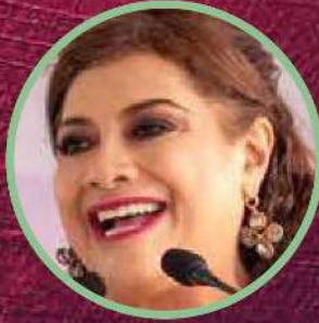
Clara Brugada Alcaldesa con licencia de Iztapalapa

Después de que varios morenistas levantaran la mano y varios se quedaran en el camino, está es la terna de la que podría salir el próximo jefe de Gobierno de la CDMX