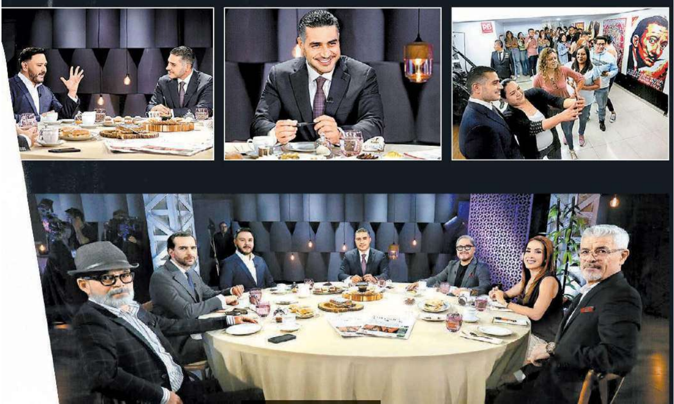
El aspirante a coordinar los comités de defensa de la 4T en Ciudad de México durante su visita a las instalaciones de Grupo Milenio. ARIEL OJEDA