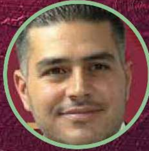
Omar García Harfuch Exsecretario de Seguridad Ciudadana