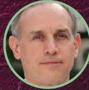
Hugo López-Gatell Subsecretario de Prevención y Promoción de la Salud