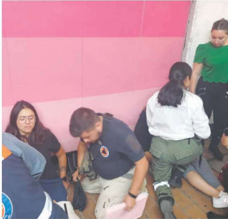
Elementos de PC atendieron a las personas heridas