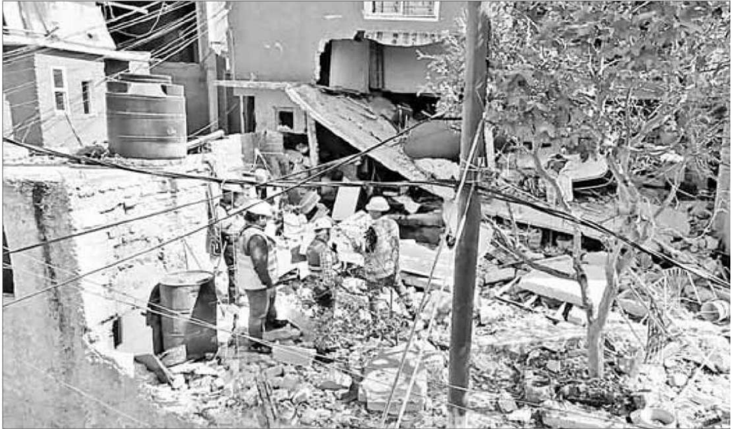
▲ Una fuerte movilización de equipos de emergencia generó la explosión por gas en una vivienda de la colonia La Pastora, en Gustavo A. Madero.