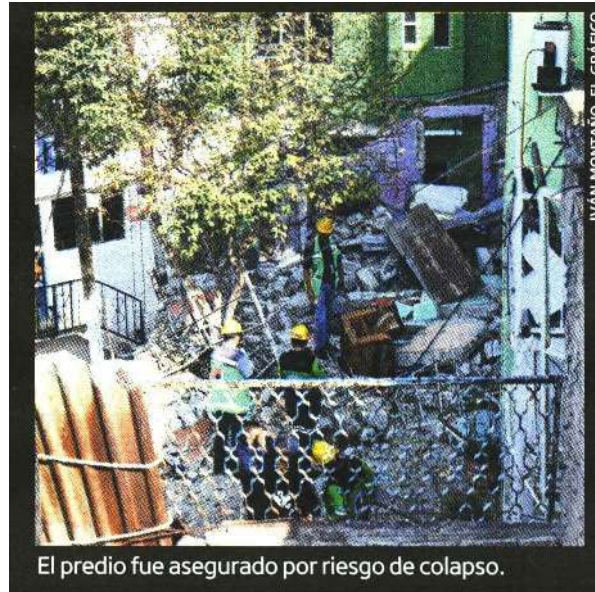
El predio fue asegurado por riesgo de colapso.

15 VIVIENDAS aledañas resultaron dañadas, según la FGJCDMX.