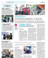
La vivienda quedó totalmente en ruinas