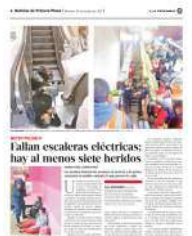
Fallan escaleras eléctricas: hay al menos siete heridos