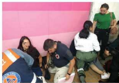
PERSONAL de Miguel Hidalgo brinda primeros auxilios a los lesionados, ayer.

"El Metro investigará si existió alguna acción premeditada, en cuyo caso, será consignada ante las autoridades correspondientes", advirtió el organismo.