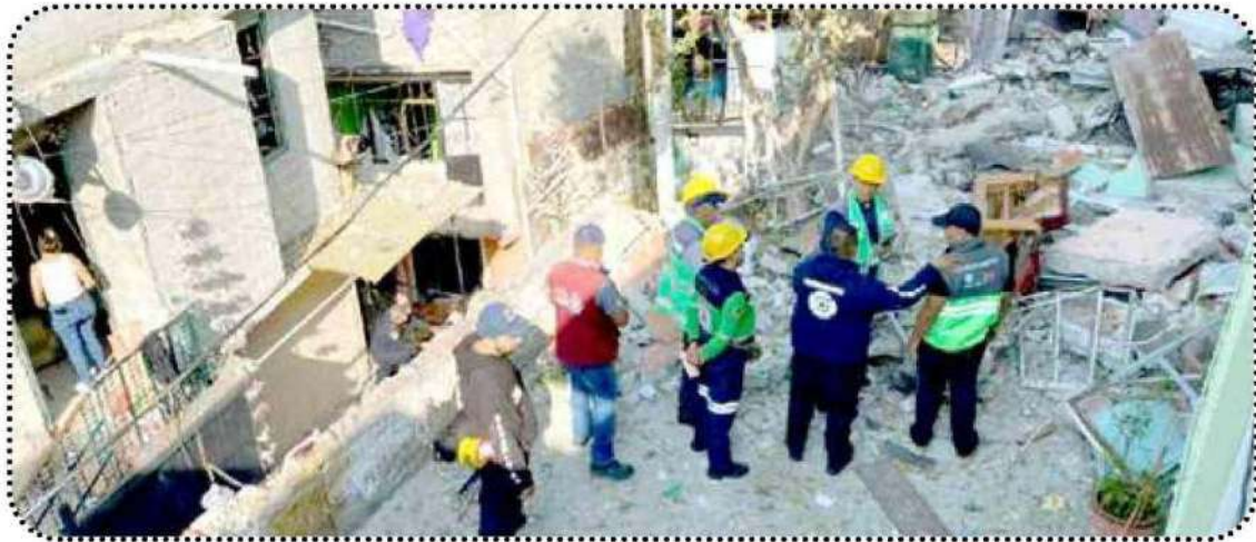
El siniestro se originó por acumulación de gas