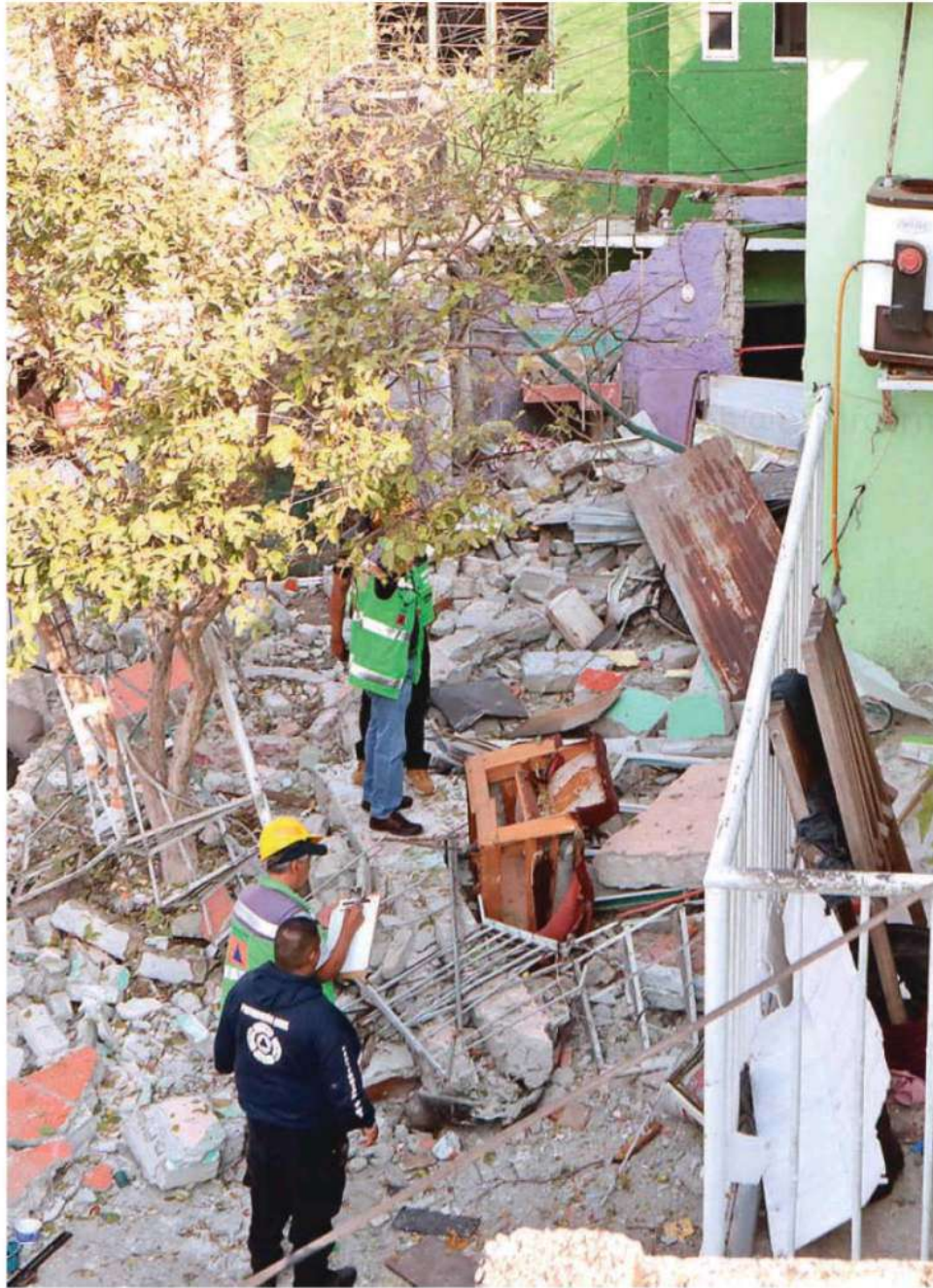
La explosión ocurrió cerca de las 06:00 de la mañana en un domicilio ubicado en Ilhuicamina y Prolongación Huitzilopochtli /LUIS BARRERA