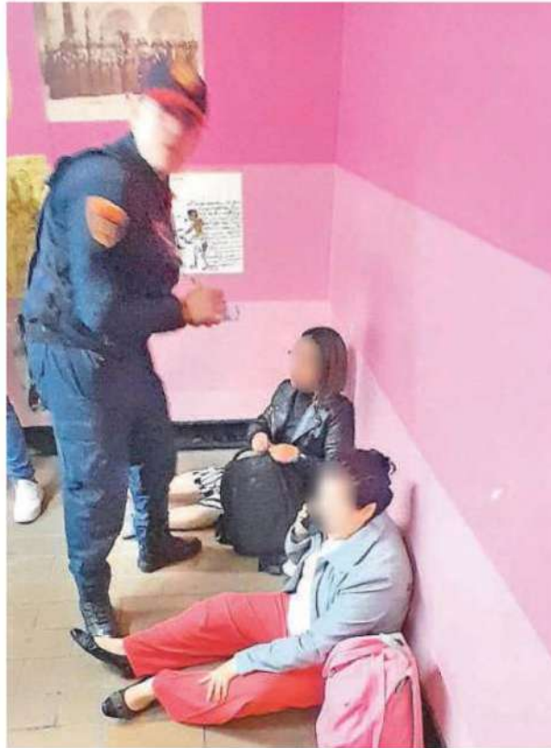
Paramédicos acudieron a la emergencia, donde dieron atención inmediata a las personas

Los asustados usuarios, solicitaron apoyo del personal del Sistema de Transporte Colectivo (STC), para atender a los lesionados sentados en el piso, algunos de ellos sin zapatos