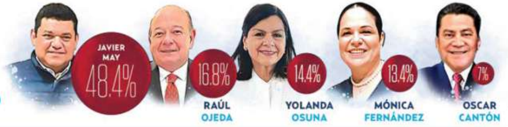
GRÁFICO: ALEJANDRO OTTEVIDES

NUEVA ERA / AÑO. 7 / NO. 2326 / MIÉRCOLES 25 DE OCTUBRE DE 2023