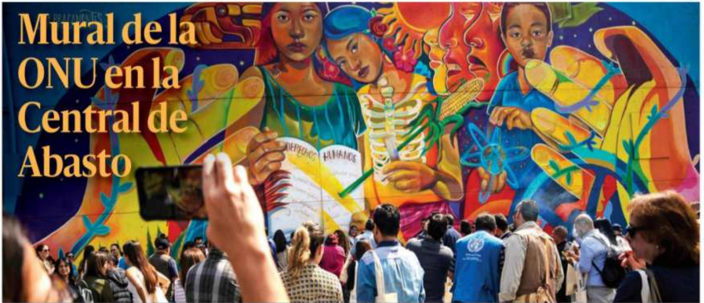
La ONU presentó ayer el mural "Todos los Derechos, Todas las Personas", de la artista urbana Eva Bracamontes, en la Central de Abasto de la Ciudad de México, con el cual buscan reflexionar sobre los problemas de los derechos humanos que preocupan en México. PAG 15