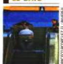
Personal del Metro verificó el funcionamiento del equipo y de los mecanismos de seguridad.

Metro reportó que el lunes emitió una convocatoria en la Gaceta Oficial de la Ciudad de México para participar en una licitación pública nacional referente a la "Adquisición de Escaleras electromecánicas para su instalación en diversas estaciones de las líneas 3, 7 y 9 de la red del Sistema de Transporte Colectivo".