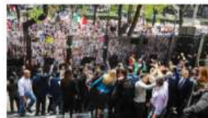
PROTESTA de trabajadores del Poder Judicial afuera del Senado, ayer.

Segob niega afectación de derechos; hay recursos garantizados en el Presupuesto, dice; AMLO lanza cuestionamientos a la Corte págs. 4 a 6 y 8