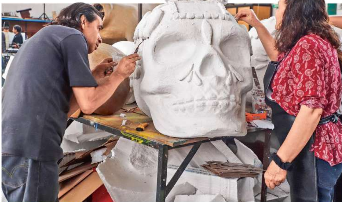
INSPIRACIÓN DEL MICTLÁN. Con su creatividad y amor a las tradiciones mexicanas, integrantes del colectivo Última Hora en la Fábrica de Artes y Oficios (Faro) de Oriente construyen los carros alegóricos para el desfile de Día de Muertos CDMX P. 8