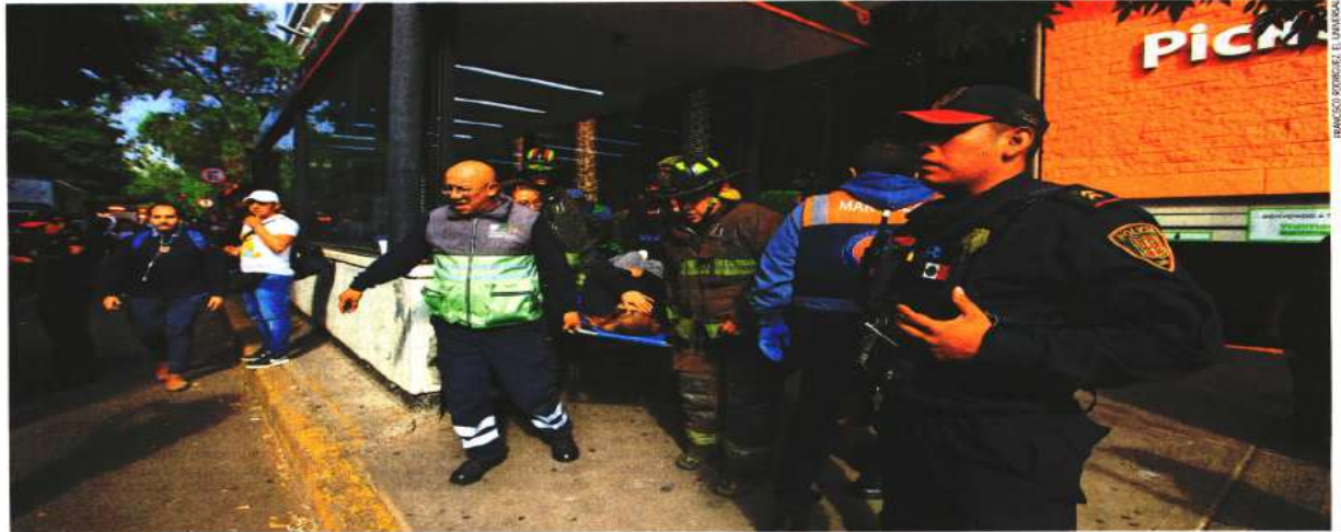
Las lesionadas fueron trasladadas a un hospital: cinco habían sido dadas de alta y dos permanecían en observación.

fueron consideradas como víctimas indirectas por la CDHCM.