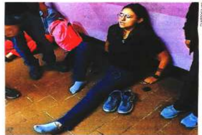
Cuerpos de emergencia llegaron para atender a las heridas. Algunas fueron movilizadas en camilla.