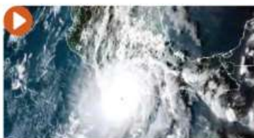
EL METEORO, ayer, momentos antes de pegar en las costas de Guerrero.

HURACÁN toma fuerza y llega a su mayor nivel; prevén que hoy toque tierra; prenden focos rojos para 30 municipios. pág. 16