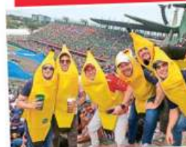
¡QUE NO TE SORPRENDAN! Disfruta la carrera sin sobresaltos, aquí las recomendaciones para asistir CDMX P. 8