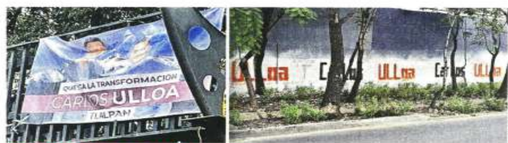
CERCANÍA QUE SE PRESUME. En la propaganda a favor de Carlos Ulloa, titular de la Seduvu, el funcionario incluso aparece retratado al lado de Omar García Harfuch.

El lunes, REFORMA publicó que el Instituto Electoral de la Ciudad de México (IECM) notificó a las 16 alcaldías y al Gobierno capitalino