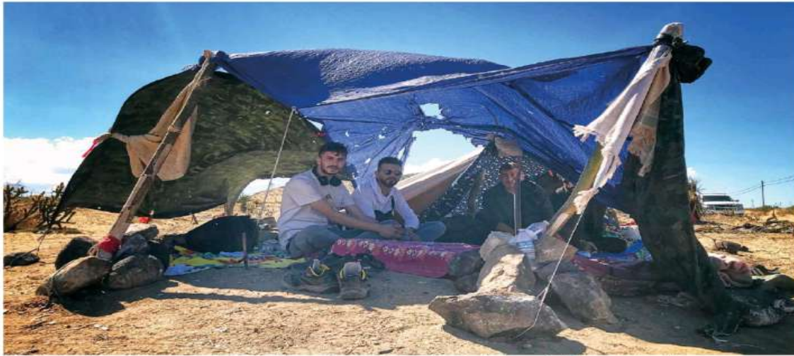
Solicitantes de asilo sobreviven a la intemperie, soportando climas extremos y resguardándose en tiendas de campaña hechas con plástico y telas.

Bajo la custodia de la Patrulla Fronteriza, son obligados a estar en campamentos improvisados, sin alimentos, agua ni atención médica, en espera de poder presentar una solicitud de asilo