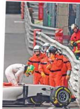
Para los oficiales de pista de F1 este no es un trabajo, sino la oportunidad de disfrutar en primera fila de su pasión por el deporte motor DXT P. 21