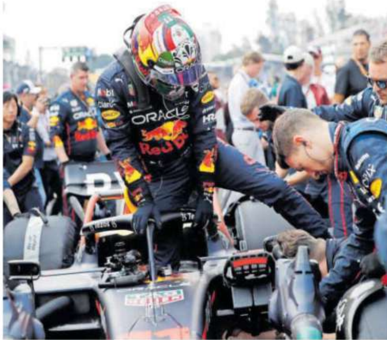
Max Verstappen ganó la Fórmula 1 el año pasado, en el Autódromo Hermanos Rodríguez.

Los giros con mayor actividad serán las ventas al por menor de alimentos y bebidas, hospedaje, restaurantes y servicios turísticos