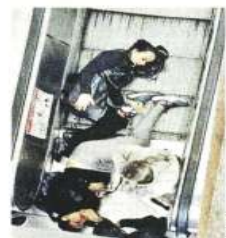
Los hechos se registraron en plena hora pico de la mañana.

■ Diciembre 2021: un menor resultó lesionado, luego de que su pie quedara atrapado en una escalera.