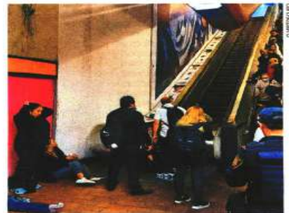
Versiones indican que el sentido de las escaleras eléctricas se invirtió. El Metro precisó que se detuvo la marcha.