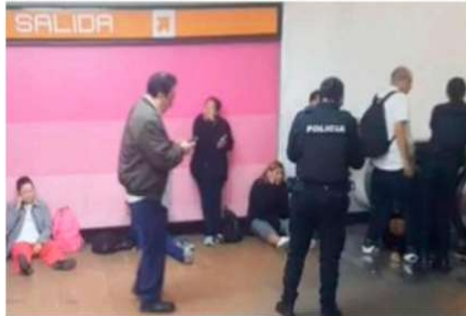
Varias personas entraron en pánico.

eléctrica experimentó una falla repentina que resultó en su paralización. En ese momento, varias personas, en su mayoría mujeres, se vieron arrastradas hacia el suelo, lo que causó momentos de pánico entre los presentes.