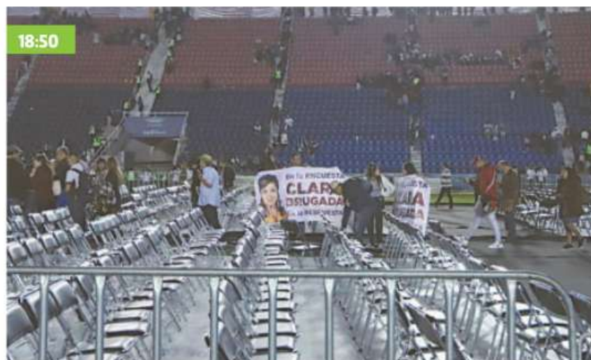
Los militantes no esperaron a que terminara el mensaje de Delgado y abandonaron la cancha

Delgado pidió a los militantes realizar un evento de altura que reciba y reconozca el trabajo de la coordinadora de los Trabajos de Defensa de la Transformación.