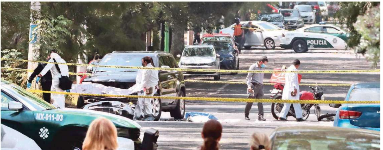
El motorista cayó frente a la camioneta y su motocicleta derrapó unos metros hasta que se detuvo