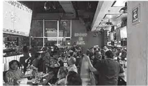
· Dueños serán sancionados

· Destacan ausencia de cámaras de seguridad en los antros