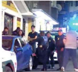
El caso causó conmoción

La madre del joven que provocó la tragedia aseguró que estaba enfermo de esquizofrenia.