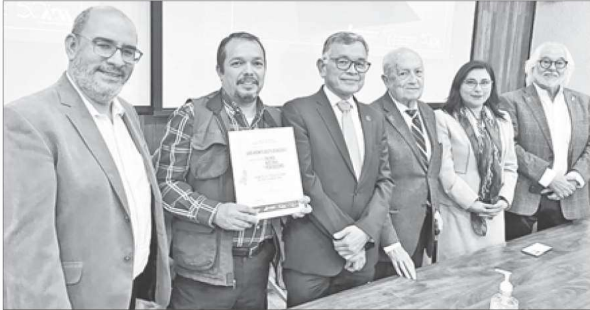
► Ceremonia de premiación.