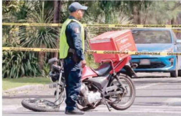
La zona quedó a resguardo de los uniformados de la zona y elementos de la Guardia Nacional