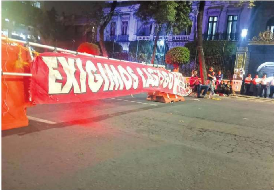
Responde Batres con violencia policiaca, aseguran