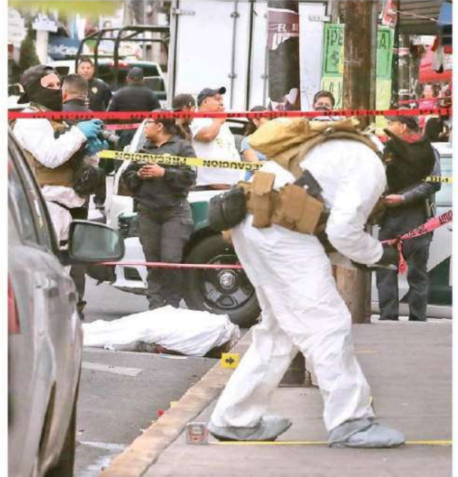
Por lo menos 15 disparos de arma de fuego recibieron los checkadores, uno murió en el lugar, el otro fue trasladado grave al hospital