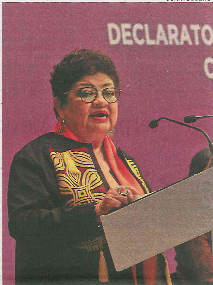
Ernestina Godoy, fiscal de Justicia capitalina, en la presentación anual del informe.

“Estamos mandando un mensaje muy claro: en la Ciudad de México no habrá impunidad en contra de quien le arrebate la vi-