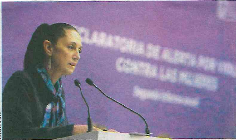
Claudia Sheinbaum. En la Ciudad de México, como Jefa de Gobierno, como mujer, tengan la certeza que aquí tienen una aliada.