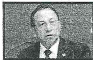
PRESENTAN SEGUNDO INFORME ANUAL de alerta por violencia contra las mujeres de la CDMX.