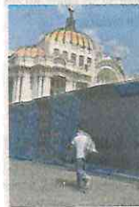
Bellas Artes cercado

..... Le contamos que desde ayer las autoridades de la Ciudad de México están diseñando la estrategia para la marcha que encabezarán