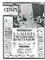
DIÁLOGO | • La Jefa de Gobierno encabezó una reunión con integrantes de la Oficina del Alto Comisionado de las Naciones Unidas.