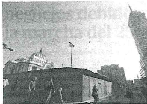
✦ Elementos de la policía capitalina empezaron a proteger zonas por las que caminarán las mujeres.

Trasciende que la Coordinación SM informó que la ruta será por Paseo de la Reforma, Avenida Juárez, 5 de mayo y así llegar Zócalo. Tienen planeado una parada en el antimonumento frente a Bellas Artes y donde se encontraba la estatua de Colón, la cual es llamada Glorieta de las Mujeres.