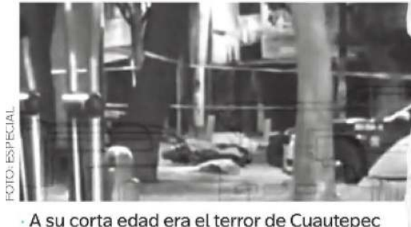
A su corta edad era el terror de Cuauhtepac

Al lugar arribaron peritos de la Fiscalía General de Justicia de la CDMX, los cuales después de realizar las diligencias