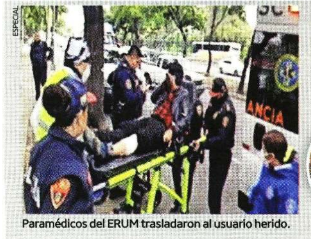
Paramédicos del ERUM trasladaron al usuario herido.

LA FISCALÍA de Justicia de la CDMX abrió 75 carpetas de investigación por delitos contra el patrimonio a transeúnte en transporte público colectivo en el mes de septiembre de este año.