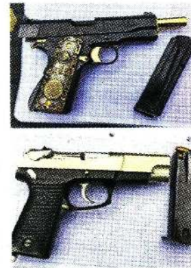
Carlos fue atorado con 2 armas y la camioneta involucrada.