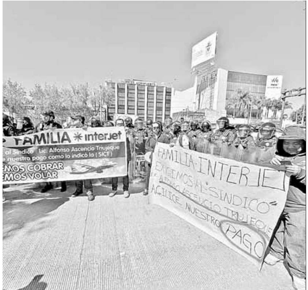
► Después de un rato de ocupar los carriles centrales, los policías replegaron a los manifestantes.

Policías de la Subsecretaría de Control de Tránsito de la Secretaría de Seguridad Ciudadana reconocieron que los efectivos encargados de vigilar cruces y avenidas son insuficientes ante los bloqueos que cada día son más comunes en la ciudad.