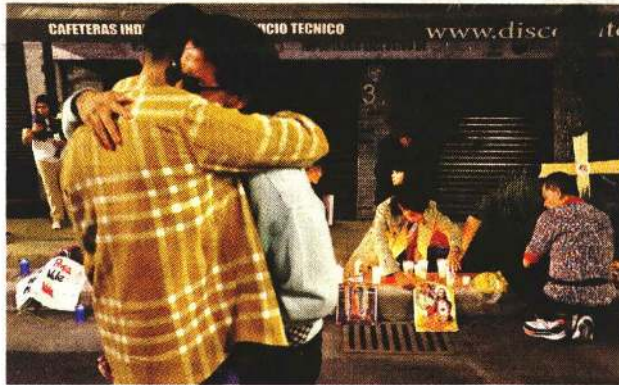
■ Ayer, familiares y amigos de la joven se concentraron en el lugar del siniestro.