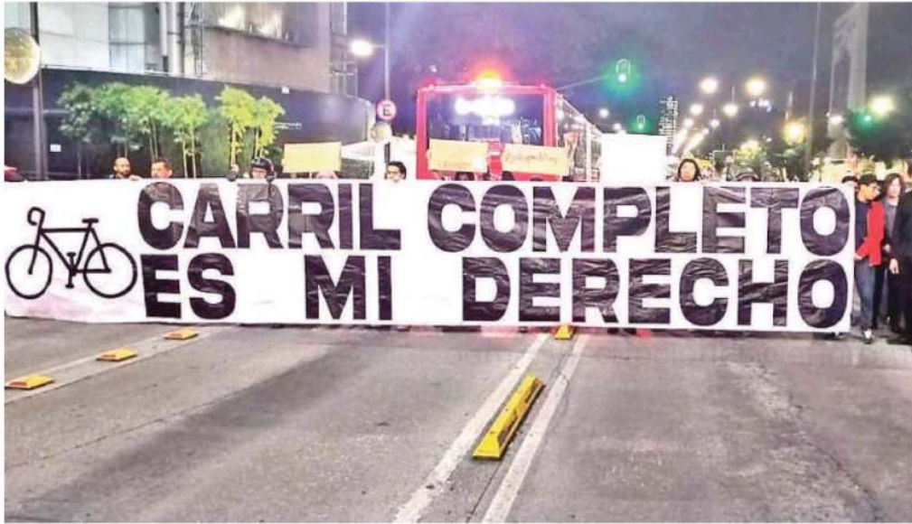
Con la manta "Carril completo es mi derecho", exigen garantías para los ciclistas en la Ciudad de México

A través de redes sociales se dio a conocer que en ese punto al menos nueve ciclistas han sido atropellados, de ellos seis murieron