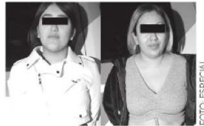
Les cayó la voladora

Los dos colegas de las mujeres se dieron a la fuga