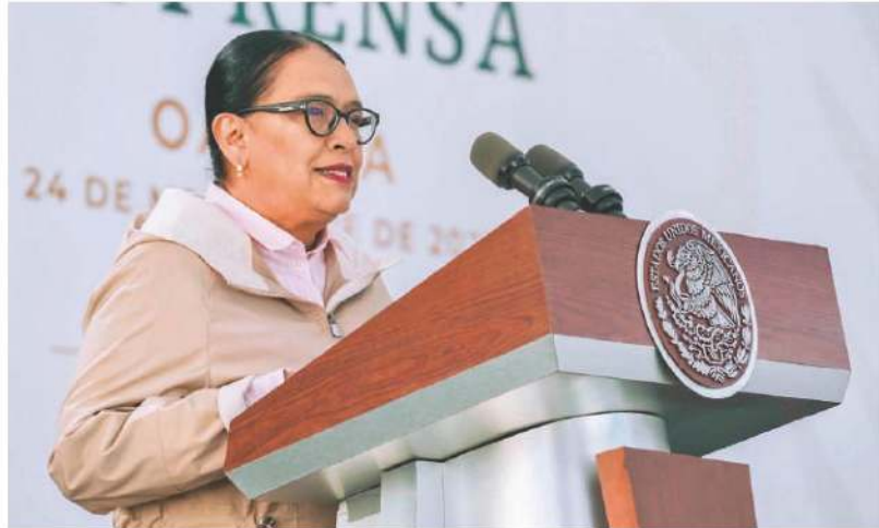
ROSA ICELA RODRÍGUEZ, secretaria de Seguridad y Protección Ciudadana, en conferencia desde Oaxaca, ayer.