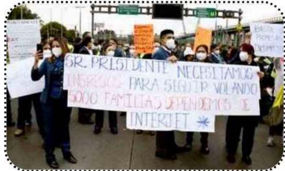
Trabajadores de Interjet exigen indemnización

Cabe señalar que en días pasados los trabajadores se dieron cita en la sede del Tribunal de Conciliación y Arbitraje Federal donde se les informó que sería cuestión de una semana máximo dos cuando serían liquidados los adeudos correspondientes a salarios y prestaciones al 100 % a todos y cada uno de los trabajadores, además de la promesa de volverlos a contratar, promesas que no se han cumplido por lo que decidieron bloquear el acceso a la terminal aérea.