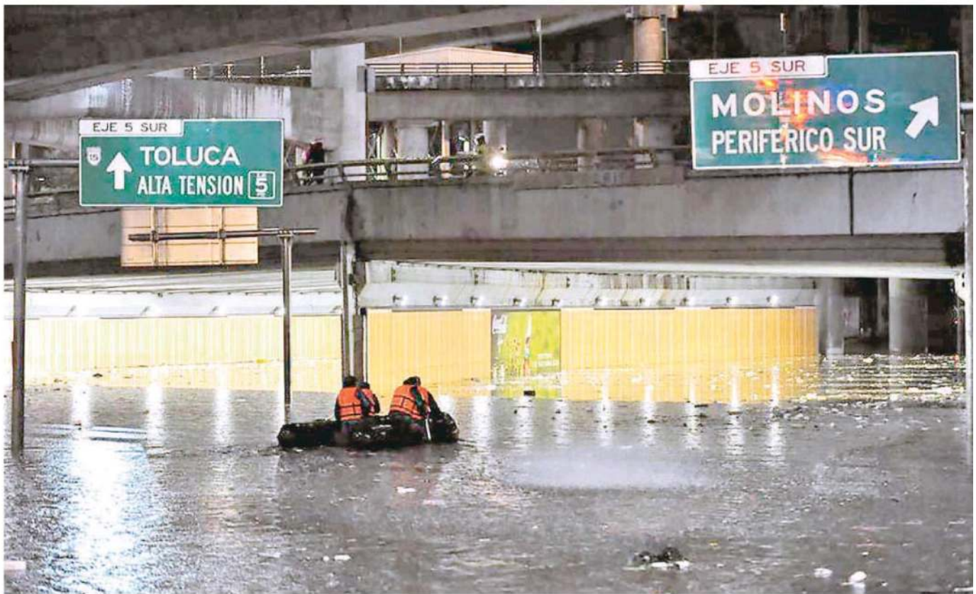
Para las autoridades capitalinas es difícil evitar que al drenaje se arrojen desechos

Es relevante la problemática por la contaminación de residuos; su impacto en el sistema de alcantarillado se debe atender