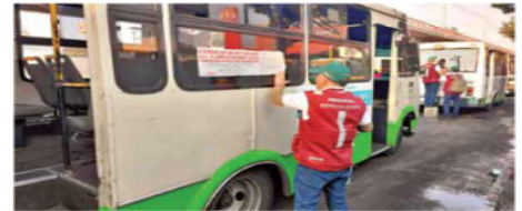
Desde el 1 de junio, se inició una serie de operativos para revisar las condiciones físicas y mecánicas de las unidades.

La diferencia en estas últimas tres olas ha sido la