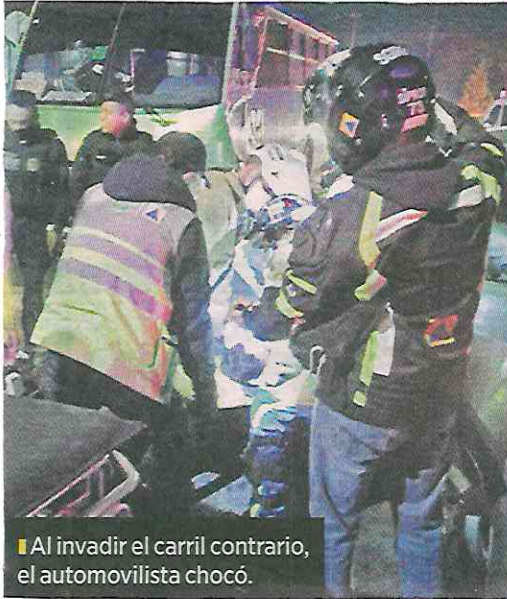
■ Al invadir el carril contrario, el automovilista chocó.