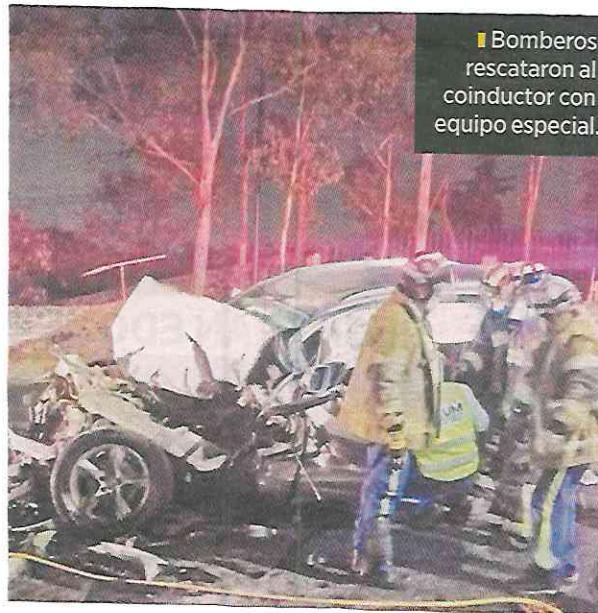
■ Bomberos rescataron al conductor con equipo especial.

Tras atender a los accidentados, los vehículos fueron remolcado a la Agencia del Ministerio Público TLP-4 para realizar las investigaciones pertinentes.