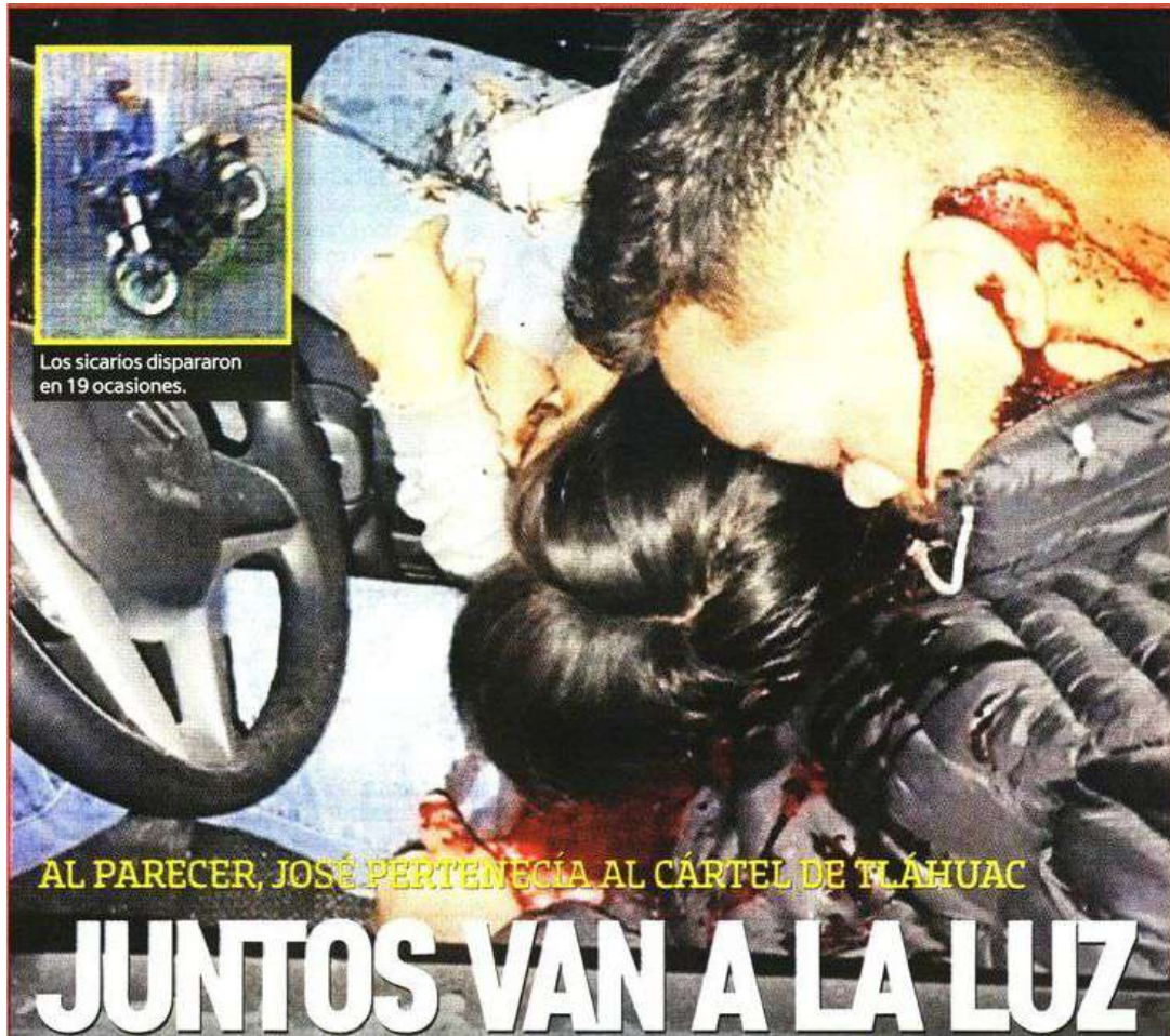
Los sicarios dispararon en 19 ocasiones.

AL PARECER, JOSÉ PERTENECÍA AL CÁRTEL DE TLÁHUAC