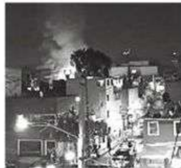
Las llamas se veían a lo lejos

Por fortuna no se reportaron personas lesionadas, solo daños materiales