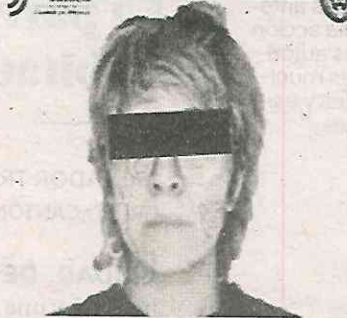
No tuvieron escapatoria