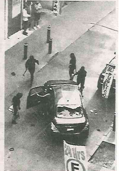
Momento de la brutal agresión