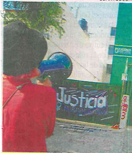
Ayer las acompañaron en la audiencia