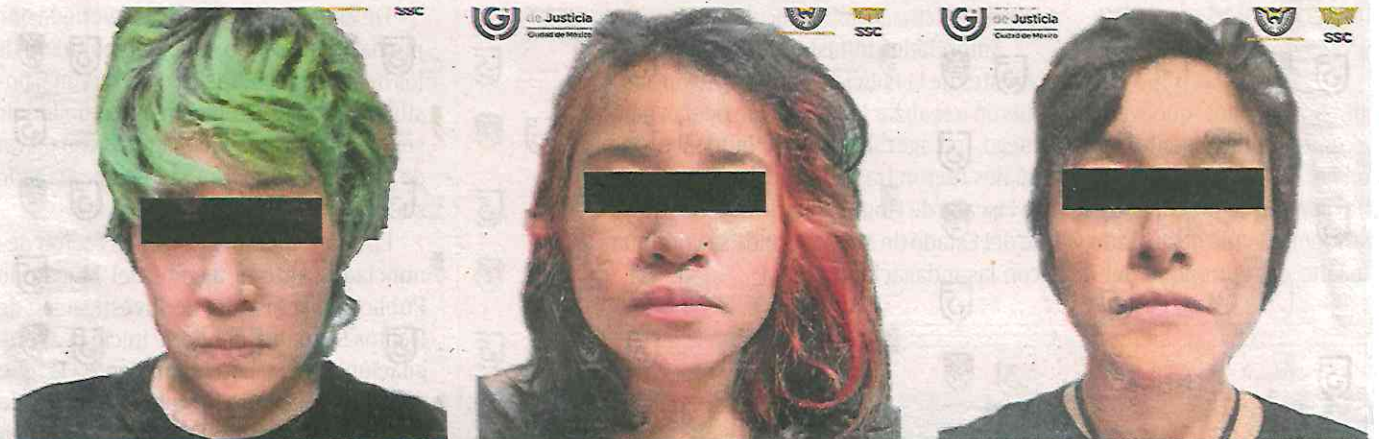
Se ordenó la medida cautelar de prisión preventiva oficiosa para las tres mujeres

El inmueble de la Comisión Nacional de Derechos Humanos en el Centro Histórico, también conocido como "Casa Okupa", estuvo ocupado durante 19 meses por diversos grupos, fue entregado a la CNDH, en cumplimiento a una orden de cateo, solicitada y obtenida por el Ministerio Público.