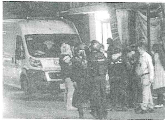
➔ El sujeto estaba en los asientos traseros de la unidad pública, aseguraron ayer las autoridades.

Hasta el cierre de esta edición se desconoce la identidad del sujeto sin vida, así como de la o las personas responsables y de quien sería el dueño del taxi.