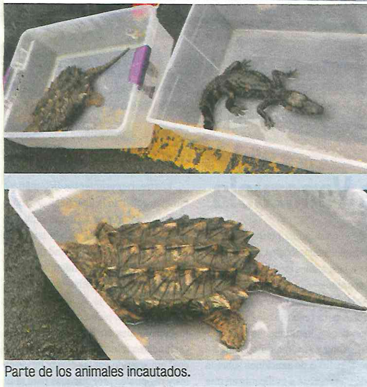
Parte de los animales incautados.

Por lo anterior, los tres hombres de 34, 26 y 31 años de edad, fueron detenidos, los uniformados les hicieron saber sus derechos de ley, y posteriormente los presentaron ante el agente del Ministerio Público correspondiente, quien determinará su situación jurídica.