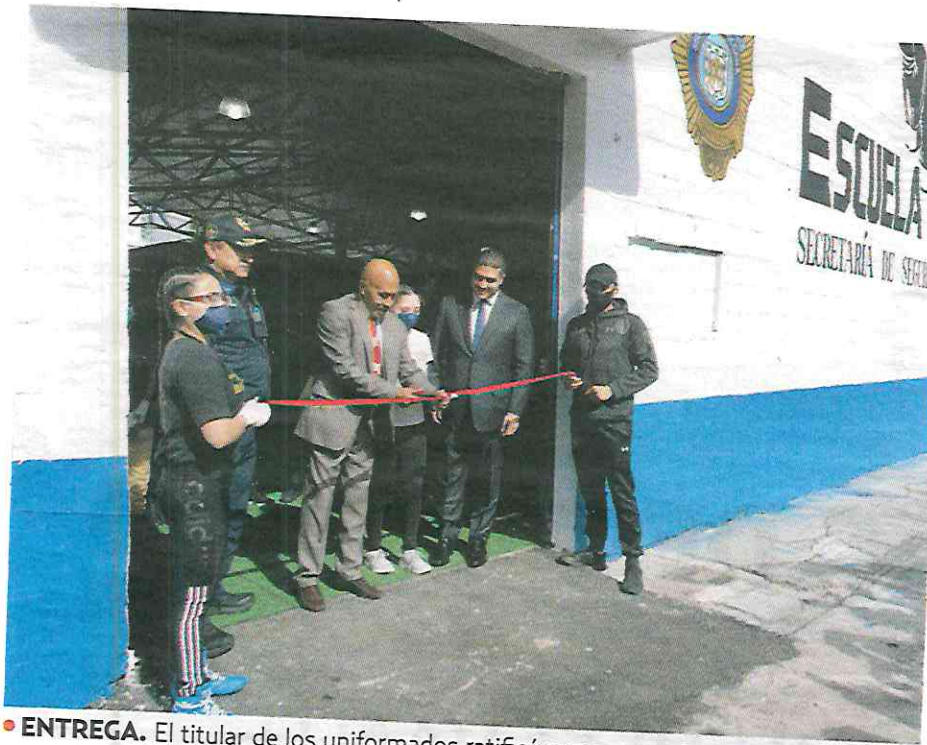
• ENTREGA. El titular de los uniformados ratificó su compromiso con el deporte.