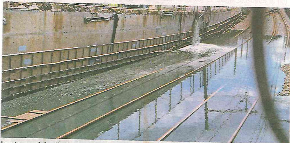
Las torrenciales lluvias inundaron las vías electrificadas de la Línea A del Metro, que corre de Pantitlán a La Paz