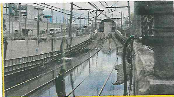
■ Más que trenes la Línea A necesitaba lanchas.