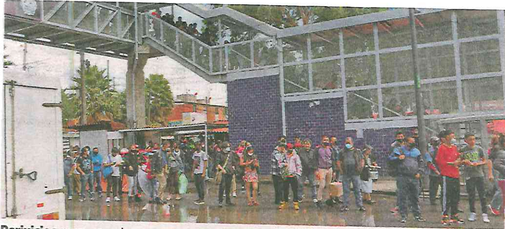
Perjuicios para usuarios en sus traslados