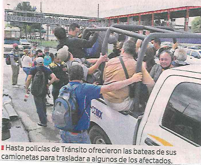
■ Hasta policías de Tránsito ofrecieron las bateas de sus camionetas para trasladar a algunos de los afectados.