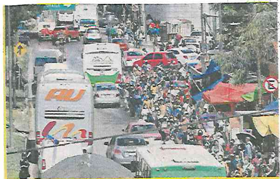
■ Toda la tarde fue un caos rumbo al Edomex.

“Se activa alerta amarilla por movimiento de tormenta”, indicó la Secretaría de Gestión Integral de Riesgos y Protección Civil (SGIRPC).