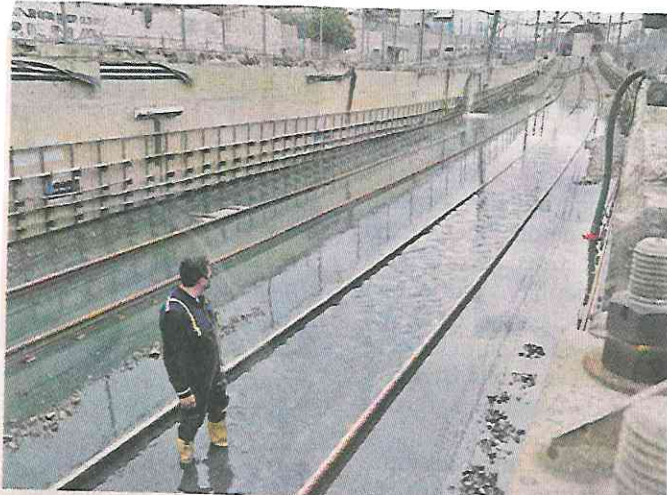
■ El encharcamiento impidió el avance de los trenes y hasta las 18:00 horas el servicio entre Peñón Viejo y La Paz se reanudó.