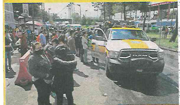
■ Hasta los patrulleros se rifaron con los afectados.