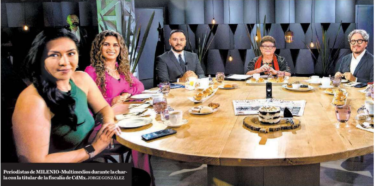
Periodistas de MILENIO-Multimedios durante la charla con la titular de la fiscalía de CdMx. JORGE GONZÁLEZ