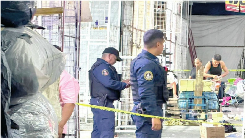
Se presume obra de extorsionadores