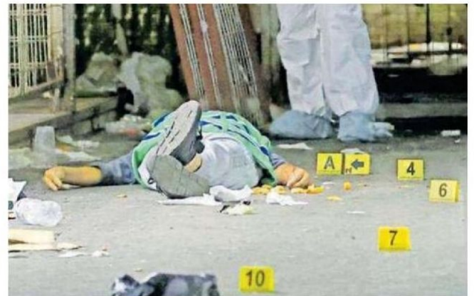
Se encontraron al menos 13 indicios balísticos, de los cuales cinco estaban cerca del tórax de la mujer