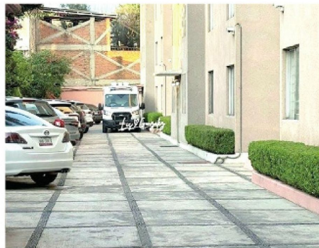
Ocurrió en su departamento

La Fiscalía General de Justicia capitalina realiza las investigaciones para establecer si en realidad se trató de un accidente.