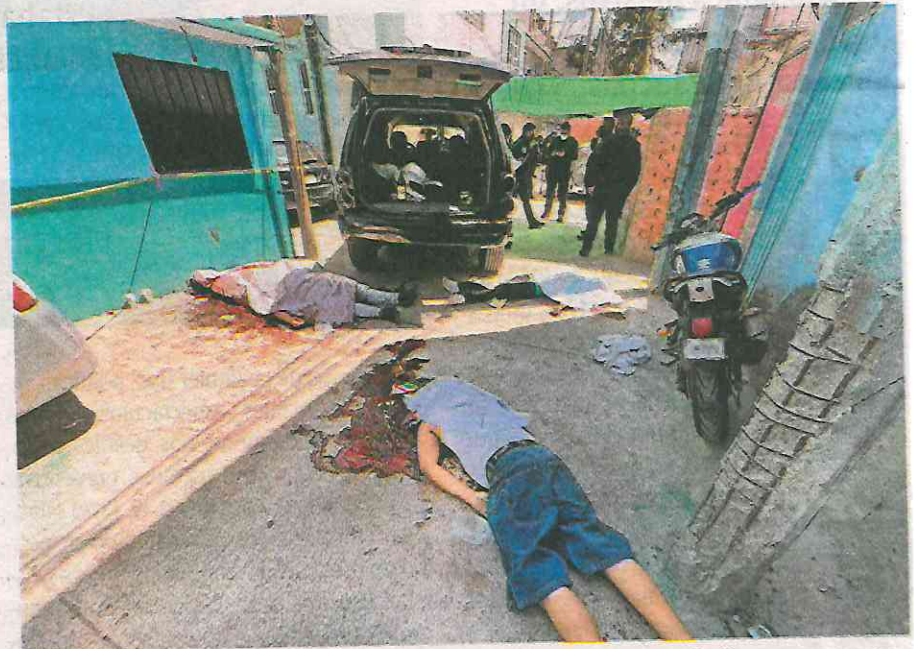
Los cuatro hombres consumían bebidas embriagantes cuando fueron sorprendidos por sujetos armados