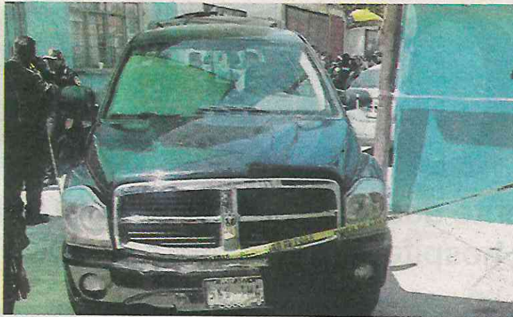
En este vehículo los acribillaron

La matanza se registró la tarde de ayer en la Cerrada Calle 9 y Las Palmas, donde se encontraban cuatro sujetos tomando bebidas embriagantes a bordo de una camioneta Durango color negra, placas de circulación 569-THG, cuando dos pistoleros a bordo de una motocicleta se les acercaron y sin mediar