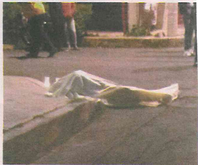
Tras escuchar varios disparos la esposa de la víctima salió de su casa al negocio donde yacía el cadáver de su pareja.

Testigos aseguran que unos hombres salieron del local donde ocurrió el crimen y abordaron un auto para escapar por la calle Hansel y Gretel, pero no aportaron más datos de los probables homicidas. Redacción