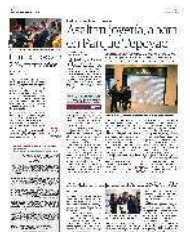
EL JEFE de Gobierno saluda a una elemento de la PDI, ayer.