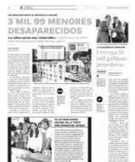
Faltan políticas públicas para prevenir esta problemática en la Ciudad de México