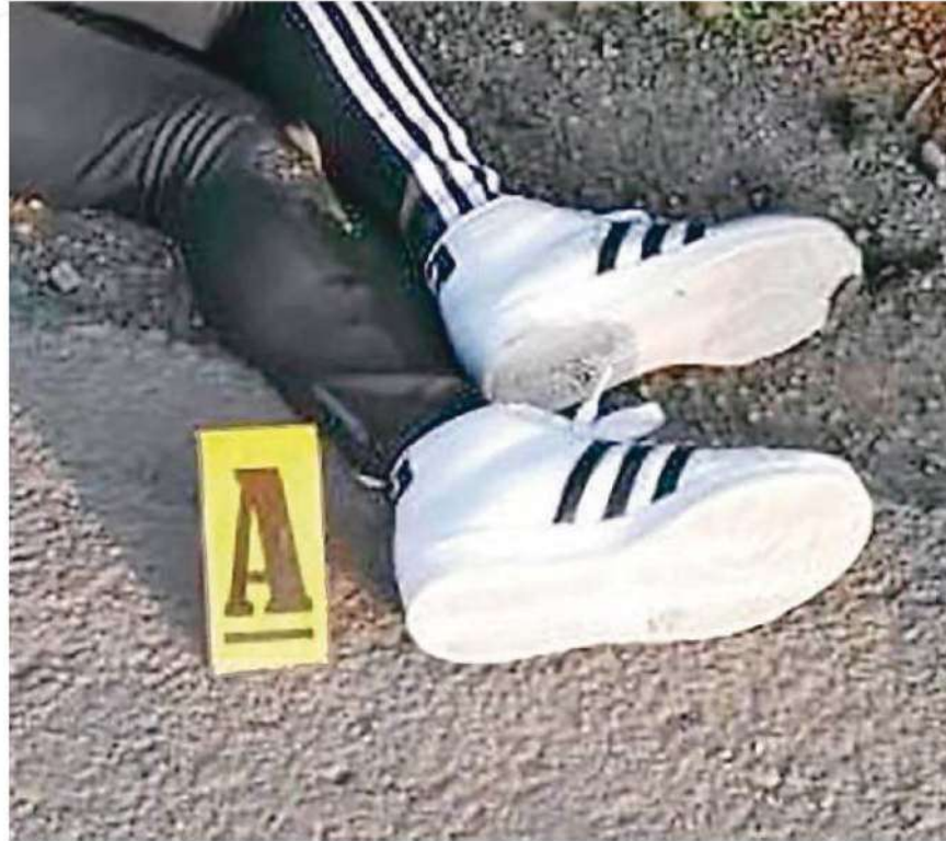
La FGJ de la Cdmx señala que aumentó en 150% el número de sentencias condenatorias obtenidas por el delito de feminicidio