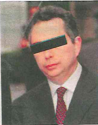
El exbanquero y su esposa, señalados por un fraude de 30 millones de dólares