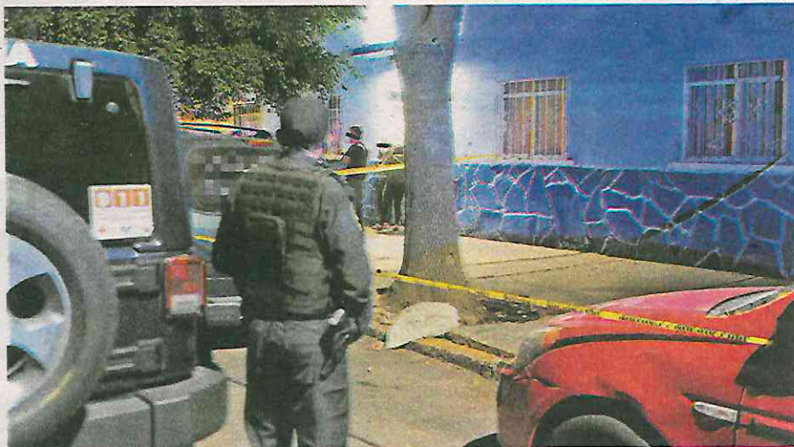
A las puertas de su domicilio fueron agredidos las cinco personas

El hombre detenido fue presentado al ministerio público en la coordinación territorial GAM-3 en esta alcaldía, así como la motocicleta que conducía y el arma que había accionado minutos antes.