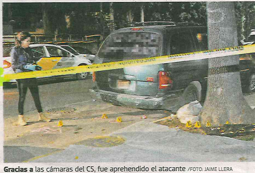
Gracias a las cámaras del C5, fue aprehendido el atacante