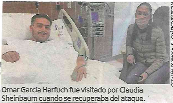
Omar García Harfuch fue visitado por Claudia Sheinbaum cuando se recuperaba del ataque.

Una llamada anónima alertó sobre un atentado que se planeaba contra Claudia Sheinbaum, este 15 de septiembre.