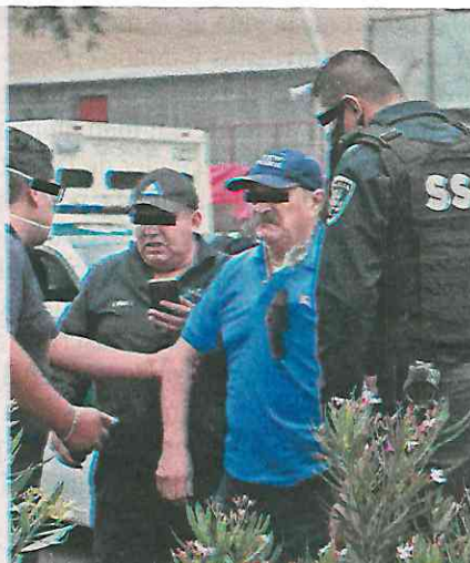
El conductor logró ser estabilizado y fue trasladado a un hospital

A su vez, paramédicos que acudieron al lugar de los hechos diagnosticaron una lesión provocada por el proyectil de arma de fuego, por lo que estabilizaron al agredido y lo trasladaron a un hospital cercano para su atención médica especializada.