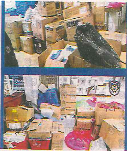
El cargamento con posibles medicamentos, insumos y productos del sector salud asegurado

control la orden de cateo para el inmueble, donde agentes de la PDI encontraron los medicamentos señalados, así como diversos insumos y sustancias con la misma leyenda; además, dos armas de fuego tipo pistola calibre 22.