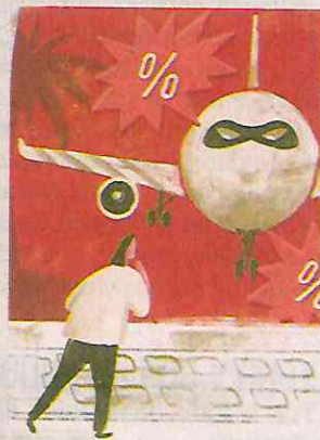
ILUSTRACIÓN: ANI CORTÉS