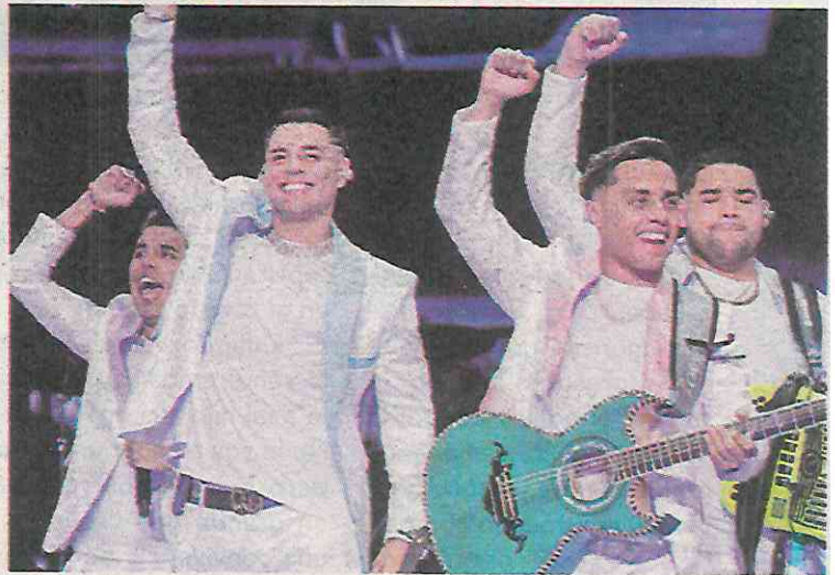
• Por más de dos horas, la banda cantó sus mejores éxitos

El concierto de Grupo Firme en el Zócalo se transmitió a través de las redes sociales oficiales del Gobierno de la Ciudad de México y de la Jefa de Gobierno, Claudia Sheinbaum Pardo.