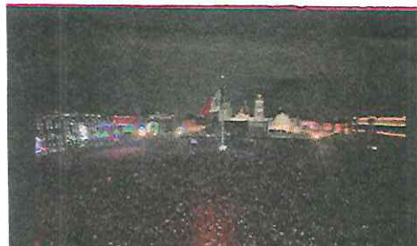
LA PLANCHA del Zócalo lució repleta, no cabía ni un alma.