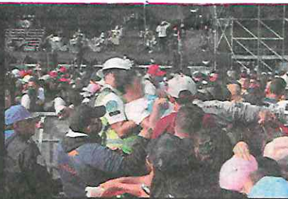
UN JOVEN desmayado es trasladado por paramédicos.

Durante el espectáculo se registraron algunos disturbios; por desmayos gente fue atendida por paramédicos.