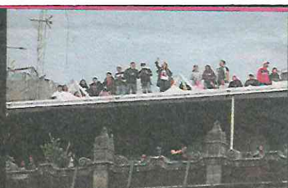
FANS desde las terrazas también disfrutaron del espectáculo.