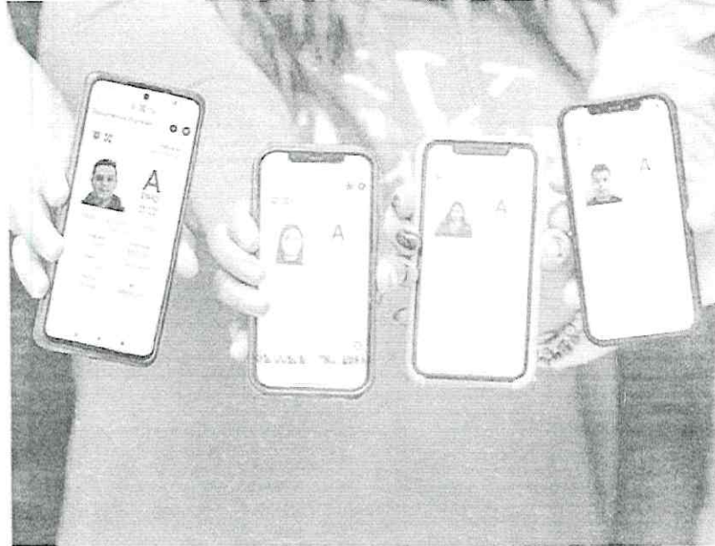
Más de 800 mil chilangos ya tienen este documento digital