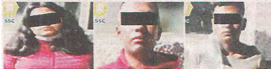
Lo atraparon con las manos en la masa

Los tres detenidos, dos hombres y una mujer ya se encuentran en manos del MP