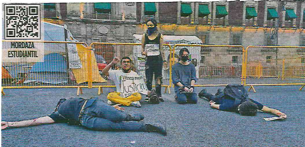
■ Alumnos de la FES Acatlán protestaron frente a Palacio Nacional para exigir, entre otras cosas, medidas contra la inseguridad y violencia de género.

ubicado en la Alcaldía Gustavo A. Madero es resguardado por oficiales de la Policía Bancaria, pero sólo vigilan las puertas y han sufrido asaltos.