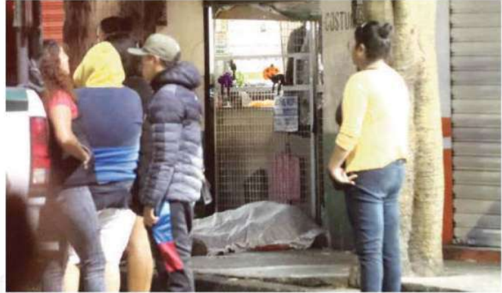
En calles de Azcapotzalco dos personas fueron asesinadas a balazos