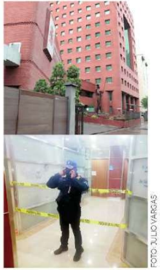
→ Continúan las pesquisas