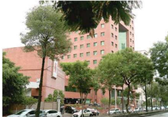
Torre Médica "Antonino Fernández Rodríguez", donde se encontraba el cuerpo sin vida de la jefa de enfermeras

Hasta el punto arriba el personal de Investigación Forense y Servicios Periciales de la Ciudad de México quienes tras concluir las diligencias hicieron el levantamiento del cadáver para trasladarlo al SEMEFO para esclarecer las causas de la muerte y saber si se trató de un feminicidio o de un golpe fatal al caer, pues presentamente sufría de una enfermedad.