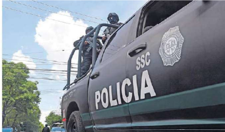
La Secretaría de Seguridad Ciudadana inició una investigación interna, luego de que un oficial resultara herido.