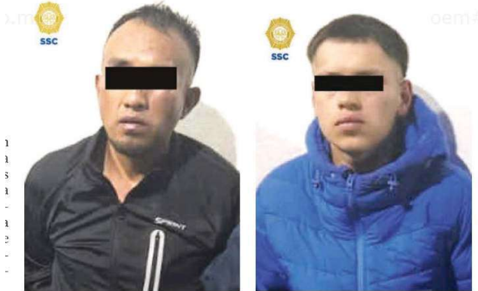
Los hombres de 18 y 30 años de edad, les informaron sus derechos constitucionales y los pusieron a disposición del agente del Ministerio Público