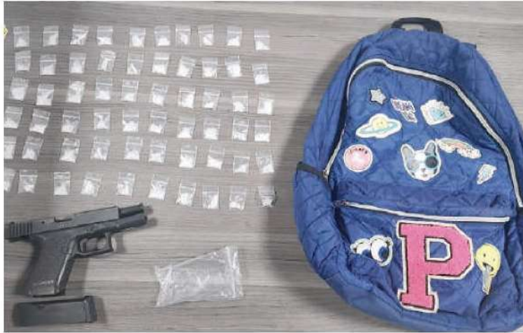
ALGUNOS de los objetos asegurados a los presuntos responsables de la agresión cometida ayer en Álvaro Obregón.