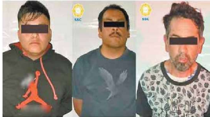
Los ligan a delitos de extorsión y homicidio en la zona norte de la capital.