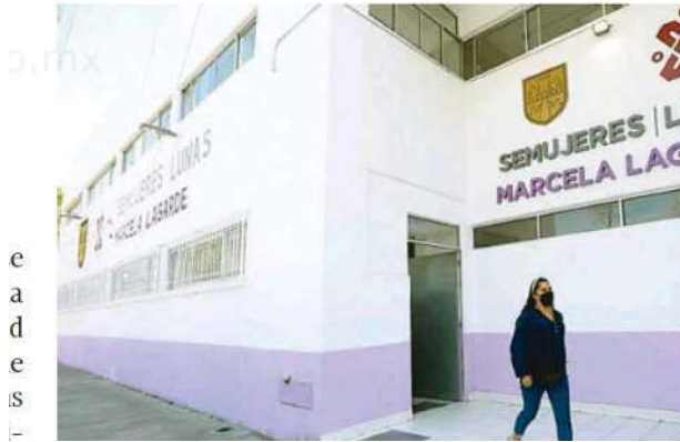
La Unidad Especializada de Género ha recibido, un total de mil 192 quejas por violencia

Las mujeres es- tán teniendo confian- za en que estamos brindando un servicio que sí está haciendo la diferencia