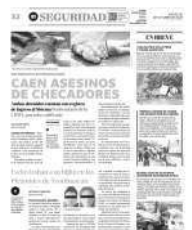
Uno murió y el otro resultó herido de gravedad