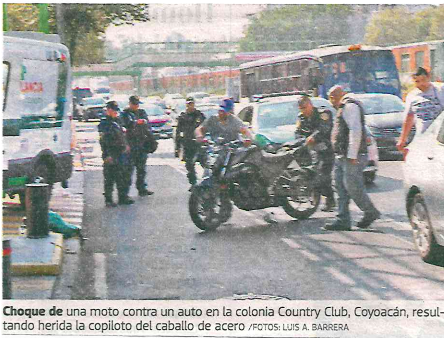
Choque de una moto contra un auto en la colonia Country Club, Coyoacán, resultando herida la copiloto del caballo de acero