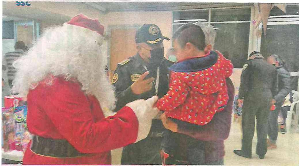
Todo fue bajo un ambiente amable y bien sanitizado por aquello del Covid-19