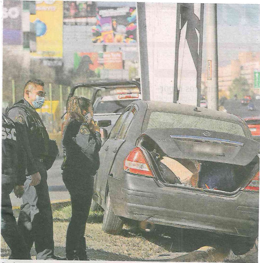
Conductores que presenciaron el accidente llamaron al 911 y pidieron el apoyo de personal de urgencias médicas