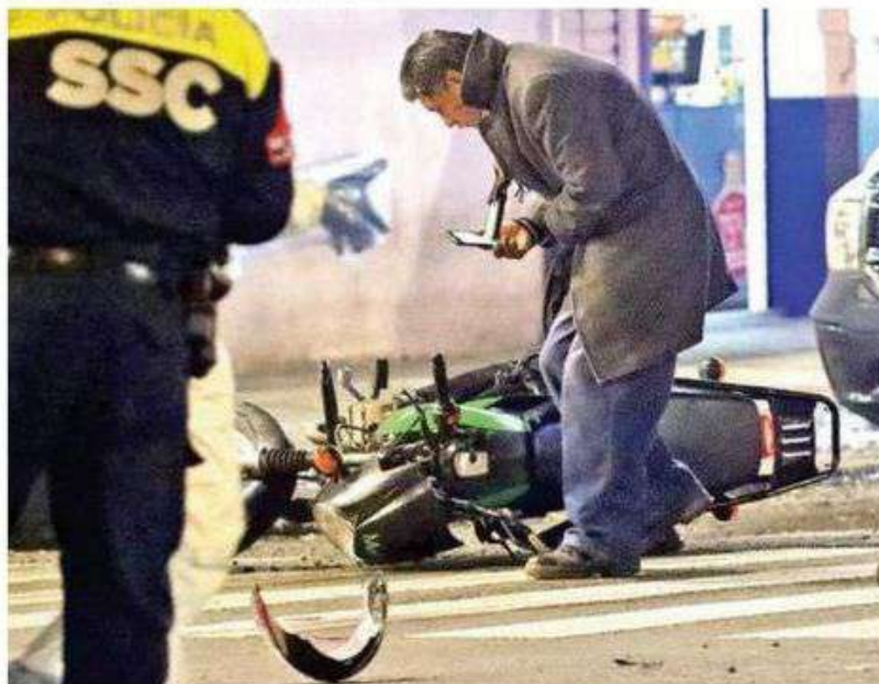
Los hechos ocurrieron sobre la avenida Cuitláhuac en su esquina con la calzada Camarones