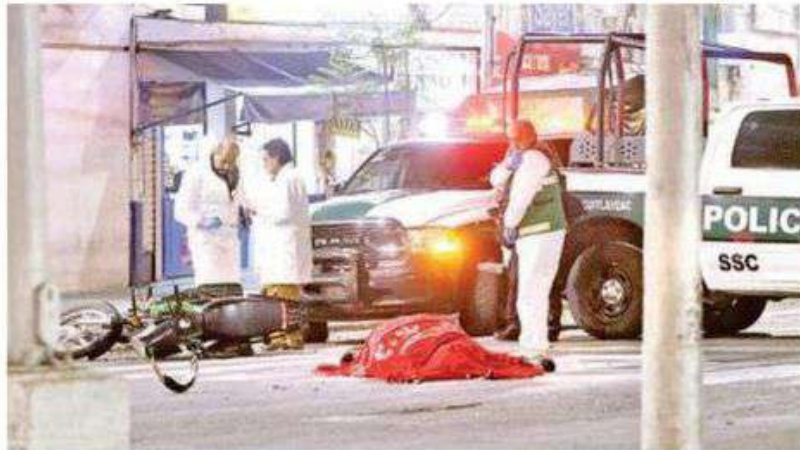
Peritos de la FGJ de la CdMx que tras concluir las diligencias trasladaron el cadáver al anfiteatro