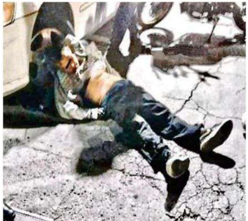
El hombre perdió la vida durante una discusión con amigos la noche del pasado domingo

El cadáver del hombre fue llevado al anfiteatro local, donde le practicarán las pruebas del ley que se integrarán en la carpeta de investigación, para continuar con la búsqueda del o los responsables para deslindar responsabilidades.