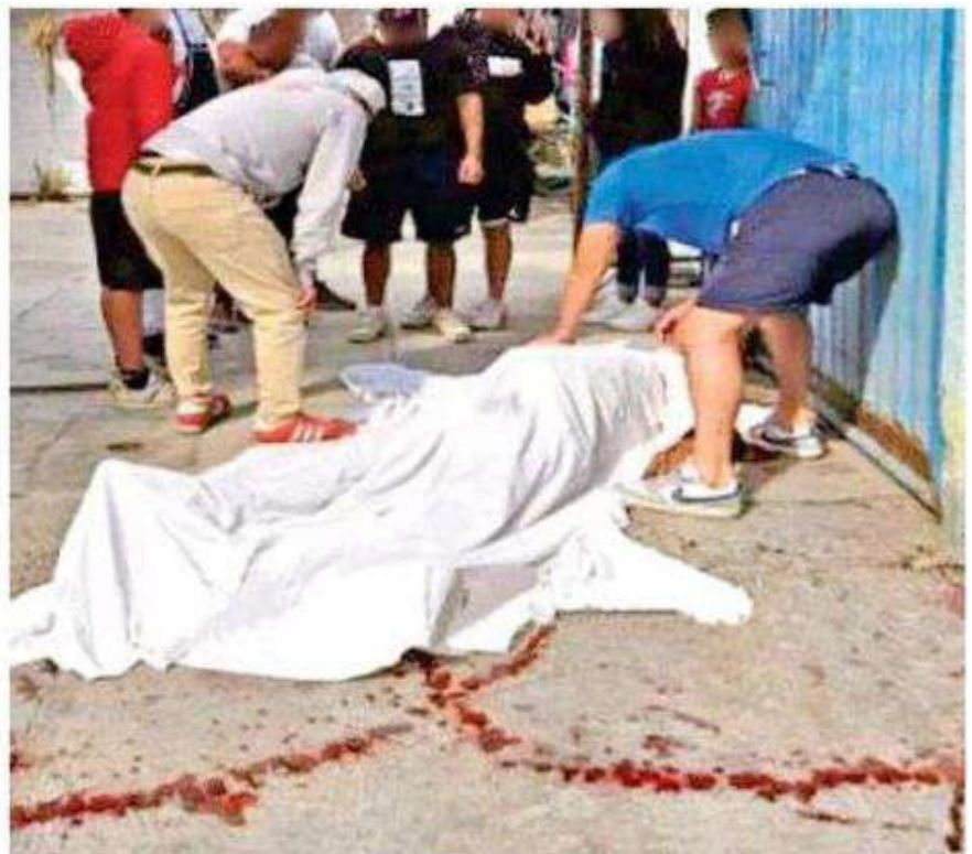
El dueño del automóvil estacionado sacó un arma y lo persiguió, al tenerlo a una corta distancia abrió fuego en su contra

La zona quedó acordonada y resguardada por los uniformados hasta el arribo de Servicios Periciales quienes tras hacer la recolección de indicios balísticos hicieron el levantamiento del cuerpo sin vida y lo trasladaron al anfiteatro correspondiente donde continuaran las investigaciones.