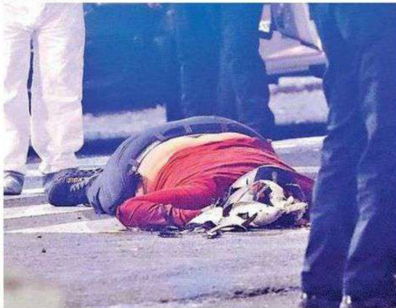
El motorista circulaba a exceso de velocidad sobre la vialidad con dirección a la Nueva Arena CdMx