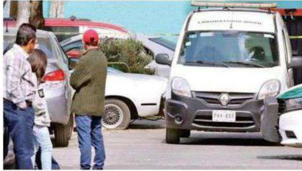
Versiones aseguran que los hombres estaban bajo la influencia del alcohol, por lo que se originó la pelea que derivó en tragedia