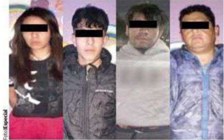
LOS PRESUNTOS responsables, en imágenes difundidas ayer por la Secretaría de Seguridad Ciudadana.