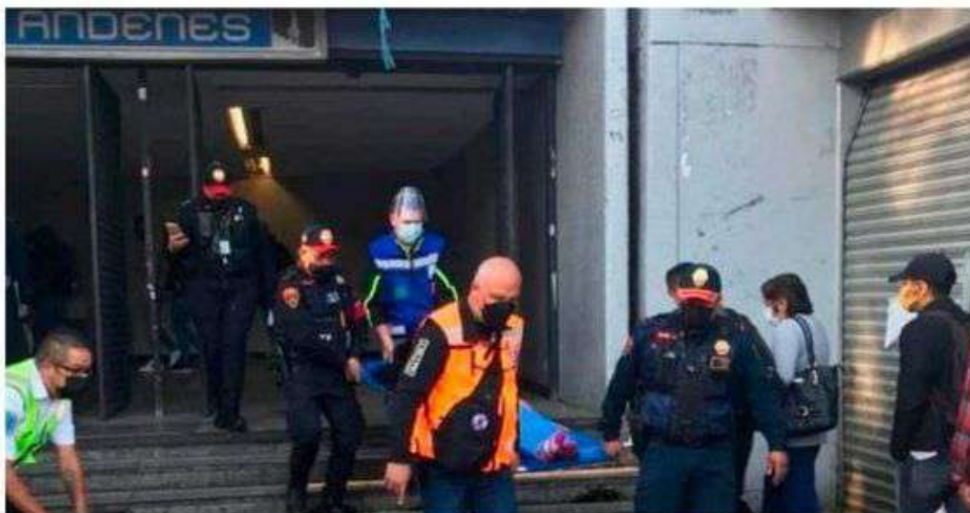
En la estación Tasqueña, paramédicos del STC atendieron el nacimiento de una niña.