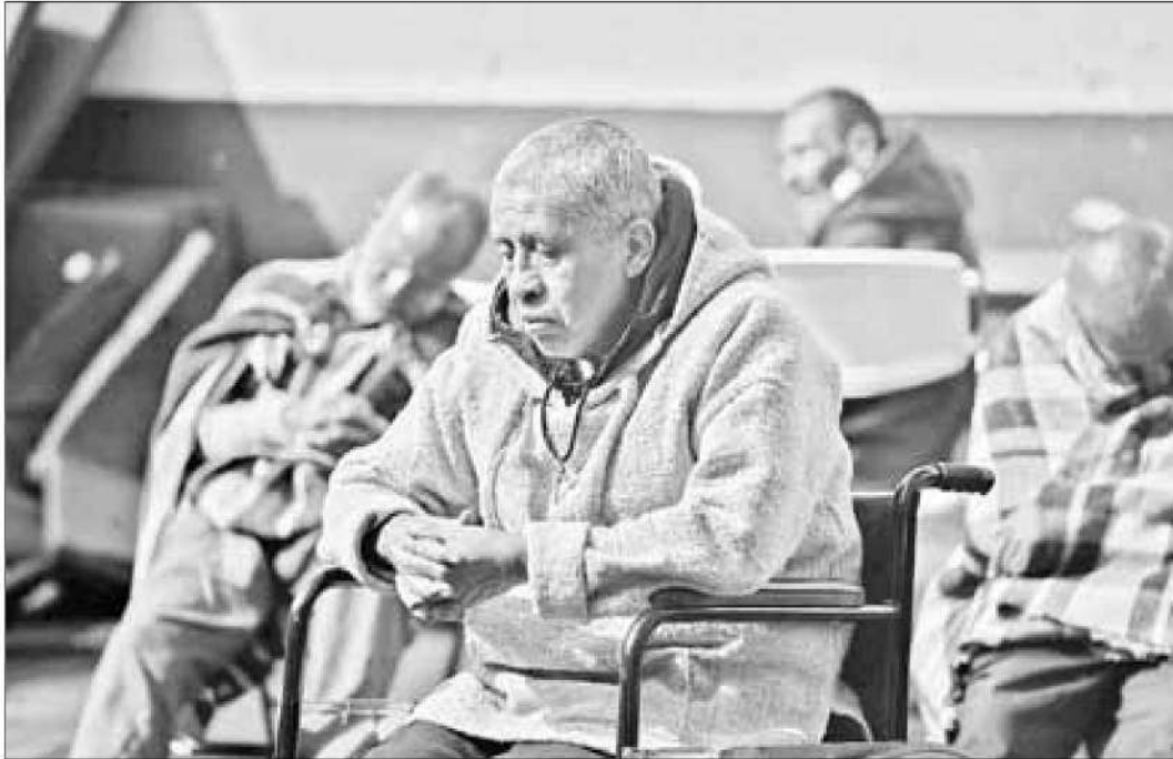
▲ Durante la actual temporada invernal se ha incrementado el número de huéspedes que reciben cobijo y alimentos durante su estancia en el albergue de Coruña.