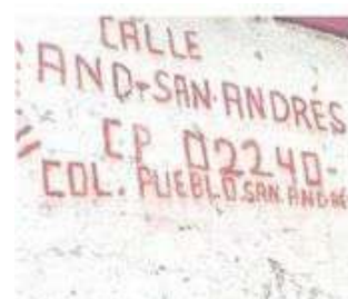
En esta calle se dio el crimen.

La FGJCDMX abrió una carpeta de investigación para dar con el paradero de los responsables