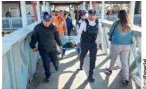
UNIFORMADOS auxiliaron a una mujer el 15 de agosto en el Metro Acatitla.

El tercer alumbramiento ocurrió en la estación Acatitla de la Línea A, donde fue auxiliada una joven de 17 años de edad que tuvo una niña. Y en agosto el parto ocurrió en la estación Guelatao de la Línea A, en donde una mujer dio a luz a un bebé.