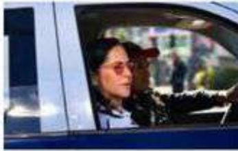
Lía Limón no bajará la guardia.

Lía Limón reiteró que la seguridad de las familias de Álvaro Obregón es su prioridad, por lo que no se bajará la guardia para seguir blindando la alcaldía.