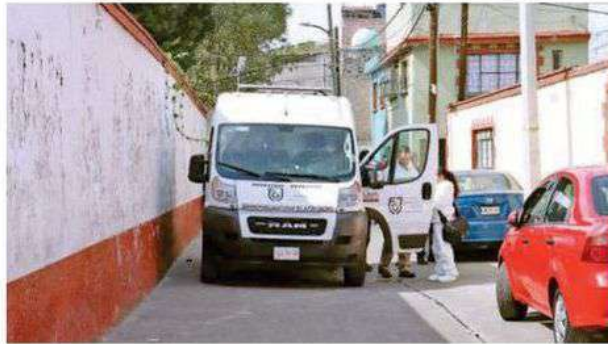
La familia preparará el último adiós del joven, cuyo cuerpo fue llevado al anfiteatro local