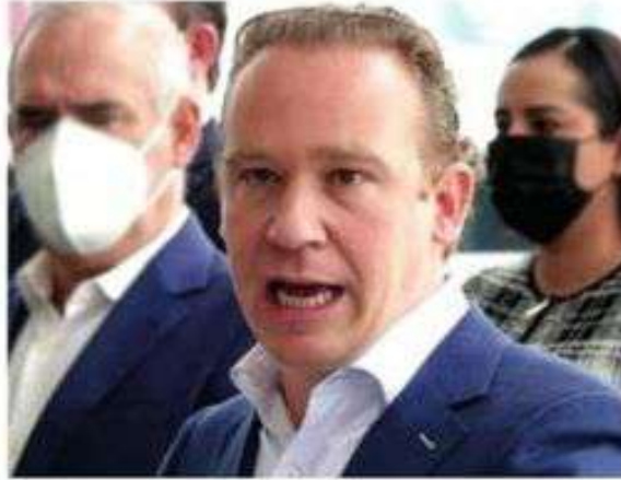
Quieren derrotar al partido guinda