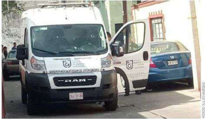
La víctima fue sorprendida mientras caminaba