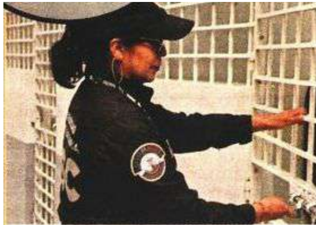
■ En esta temporada las pruebas de alcoholemia se hacen las 24 horas del día.