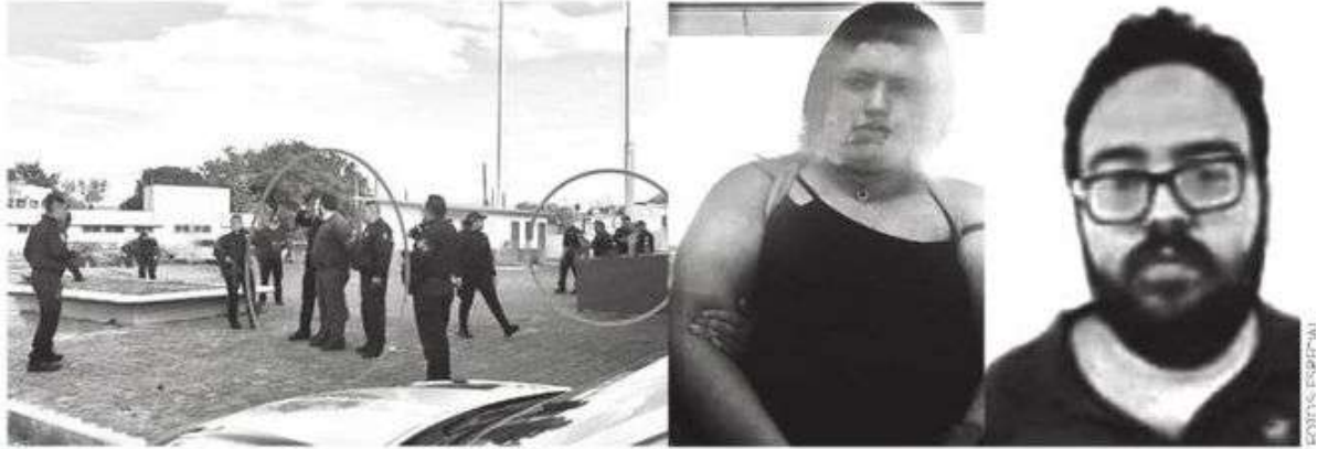
Le intentaron jugar al mago y no les salió