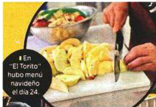
■ En "El Torito" hubo menú navideño el día 24.