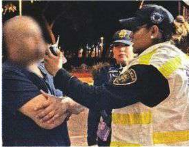
■ El programa "Conduce sin alcohol decembrino" estará vigente hasta el 7 de enero.