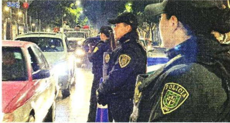
■ El programa Conduce sin Alcohol arrancó el 30 de noviembre en la Ciudad de México.