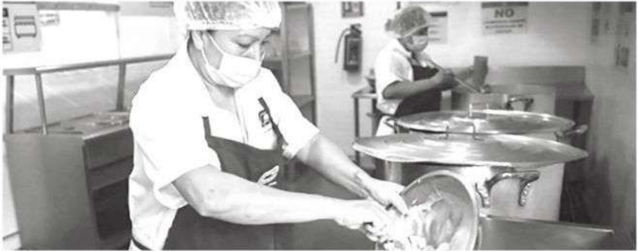
· Durante los primeros diez días de este mes, la secretaría aplicó más de 117 mil pruebas AlcoStop