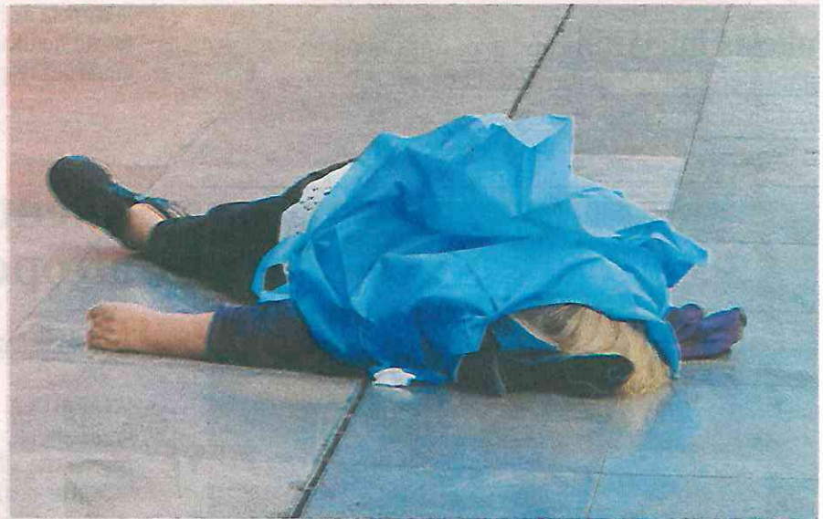
La mujer de la tercera edad caminaba con dirección hacia el Eje Central y de pronto se desvaneció

Algunos testigos de inmediato solicitaron la intervención de personal de los cuerpos de socorro y de la policía. Al lugar acudieron paramédicos, mismos que revisaron el cuerpo y diagnosticaron que ya