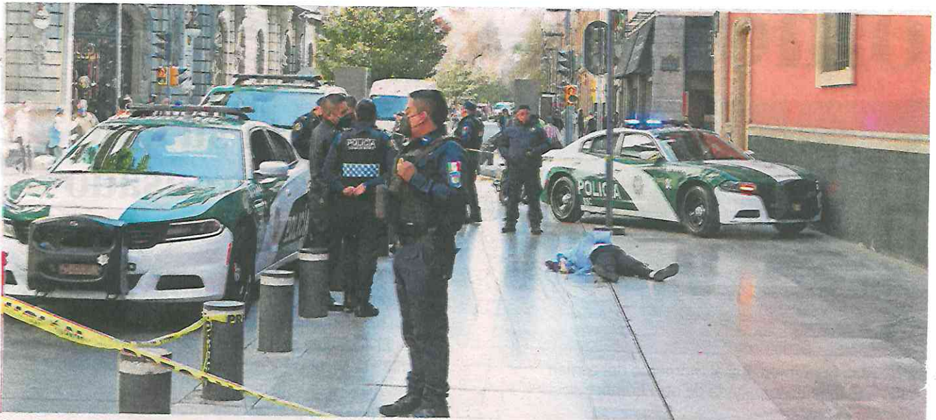
Los hechos ocurrieron sobre 16 de Septiembre casi esquina con Simón Bolívar, colonia Centro, alcaldía Cuauhtémoc