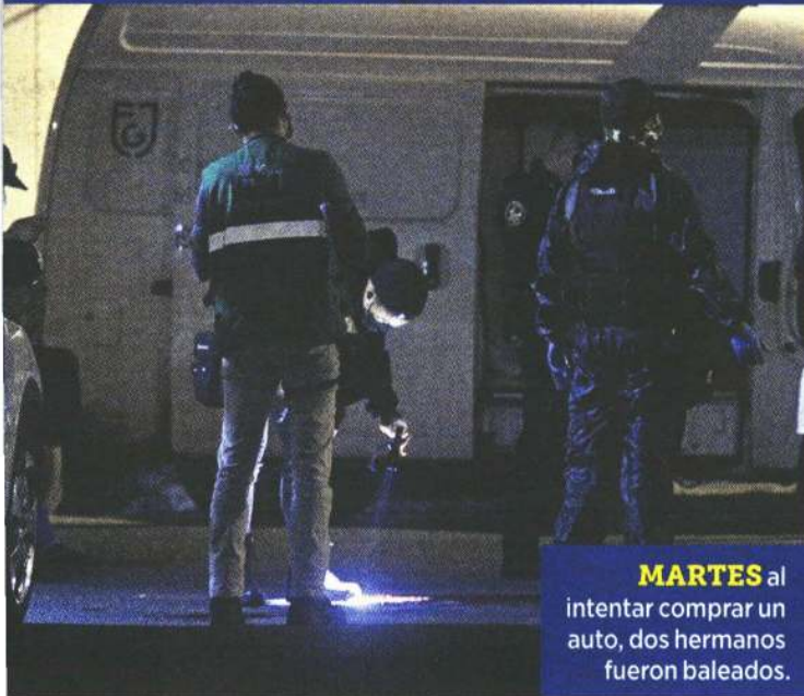
MARTES al intentar comprar un auto, dos hermanos fueron baleados.