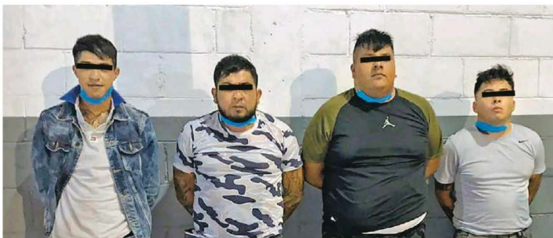
Presuntos narcomenudistas en la Zona Centro capitalina

Con base a las indagatorias de las autoridades capitalinas a dos de los arrestados también se les relaciona con un robo que fue perpetrado en uno de los centros joyeros del Centro Histórico.