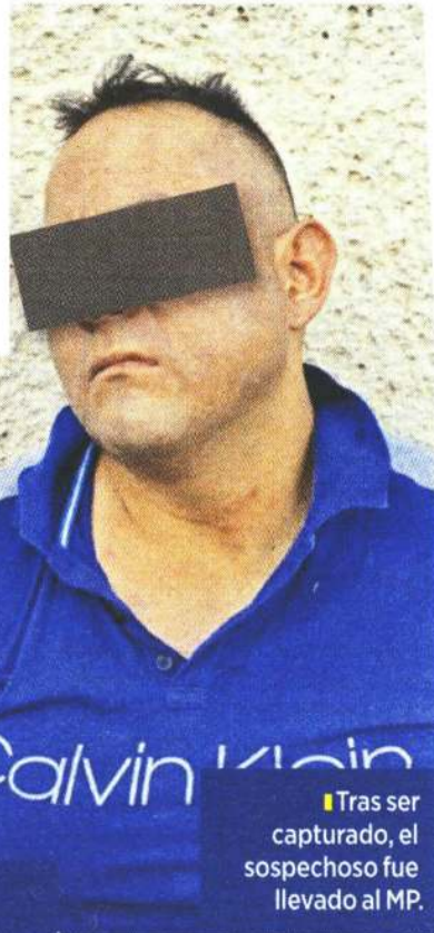
Tras ser capturado, el sospechoso fue llevado al MP.