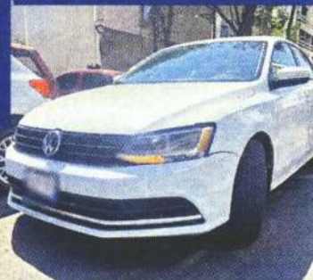
Iba armado en el auto que participó en el otro robo.

luego de la agresión agentes preventivos atraparon al sospechoso