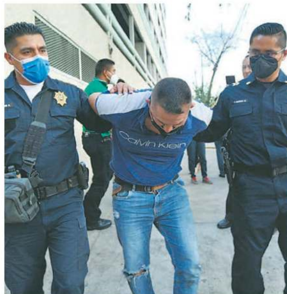
Tras su detención, este hombre fue presentado ante el agente del MP