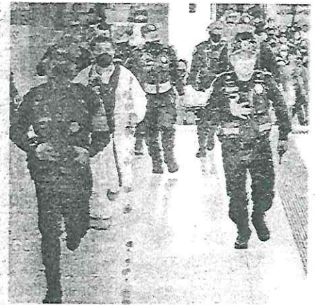
Protocolo de emergencia provocó que miles de usuarios de la Línea 1 abandonaran las instalaciones