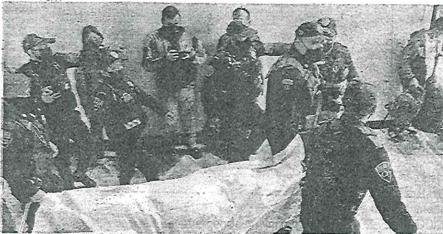
Como desconocido quedó el cuerpo de la mujer que se suicidó