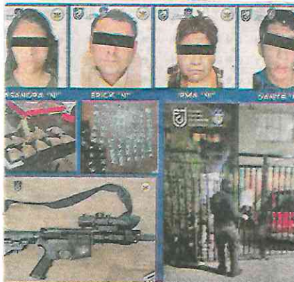
Las diligencias se realizaron en las colonias Vallejo y Ejército Constitucionalista, de las alcaldías GAM e Iztapalapa, respectivamente

Tras la lectura de sus derechos constitucionales, las personas detenidas y lo asegurado quedaron a disposición del Ministerio Público de la Fiscalía de Investigación del Delito de Narcomenudeo.