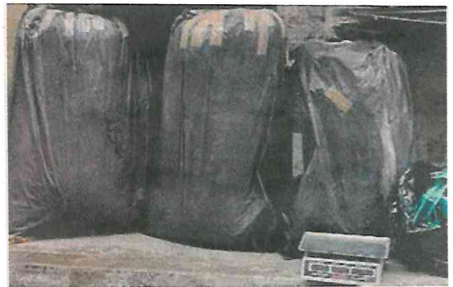
Las autoridades dieron con media tonelada de marihuana que iba a ser trasladada a Nayarit, según la investigación.

"Derivado de la información recabada de los imputados se localizó un domicilio en Iztapalapa donde se halló más de media tonelada de marihuana", se puede leer en un informe. ●