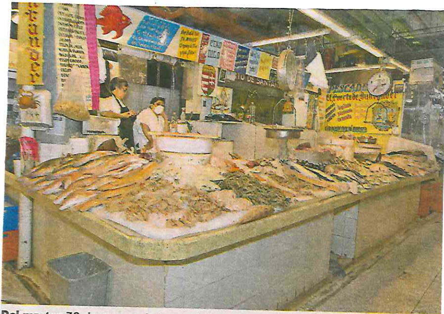
Del martes 30 de marzo al viernes 2 de abril, el operativo por Semana Santa en la Nueva Viga

Durante la Semana Santa se incrementa hasta 60% la afluencia de consumidores al tradicional centro de distribución y venta de pescados y mariscos; el operativo, del martes 30 de marzo al viernes 2 de abril