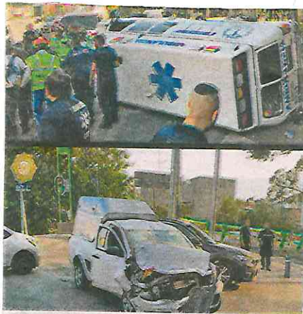
Este aparatoso choque se registró sobre Eje Central, Lázaro Cárdenas

En tanto, los policías de la SSC realizaron los cortes viales correspondientes y acordaron la zona del percance, para que los servicios de emergencia realizaran su labor, retiraran la unidad y limpiaran el asfalto.