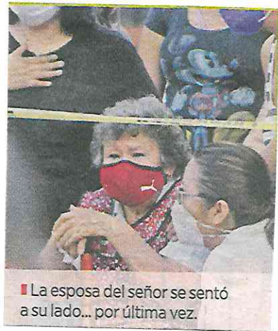
■ La esposa del señor se sentó a su lado... por última vez.

Otros familiares llegaron de poco en poco. Tristes, desconsolados, colocaron velitas a un costado del cadáver. Pusieron una silla de plástico plegable dentro del cordón para que la esposa del ciclista se sentara muy cerquita de él. Aunque fuera por última vez.