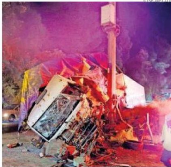
El tráiler que se quedó presuntamente sin frenos chocó contra otro camión y quedó impactado contra el poste del CS

Después de varios minutos de maniobras, se pudo rescatar el cuerpo de la víctima, mientras que en el suelo había rastro de las piezas de los dos vehículos y gasolina derramada, la cual fue cubierta con tierra por los bomberos.