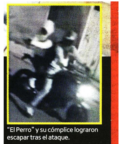
"El Perro" y su cómplice lograron escapar tras el ataque.